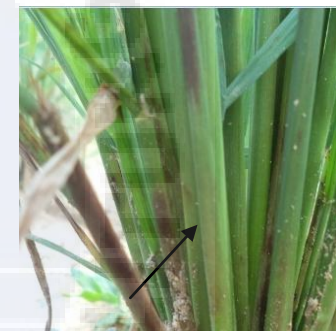
f. Warna ruas batang ( bergaris ungu )