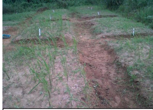
b. Foto Tanaman Padi Umur 1 Bulan