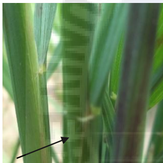
d. Warna pelepah daun (bergaris ungu )