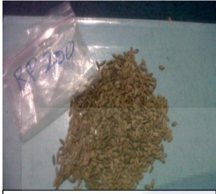
a. Rhuten Puren 200

Lampiran 2. Penampilan bernas mutan ke-2 padi beras merah aksesori (a) Rhuten puren ; (b) Balok mas ; (c) Cerak madu ; (d) Mayang anget.