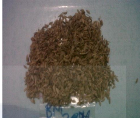
b. Balok Mas 200