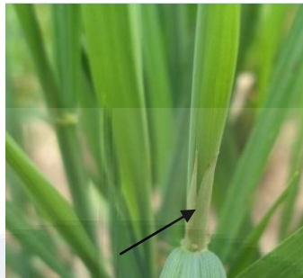
b. Warna lidah daun ( putih)