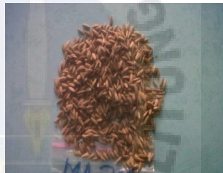
d. Mayang Anget 200