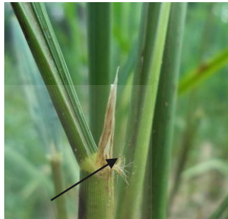
c. Warna telinga daun ( putih )