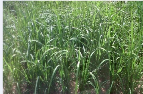
d. Umur 90 hari