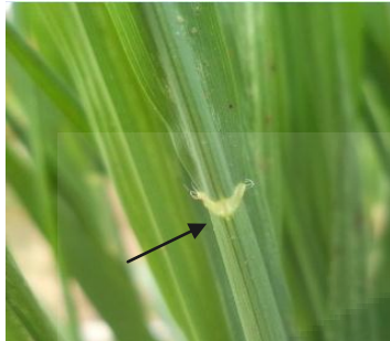
a. Warna leher daun (putih )

Lampiran 1 Penampilan karakter dalam mutan ke -2 padi merah aksesori balok mas yang meliputi : (a) Warna leher daun ; ( b ) Warna lidah daun ; (c ) Warna telinga daun ; (d ) Warna pelepah daun ; ( e ) Bentuk lidah ; ( f ) Warna ruas batang.