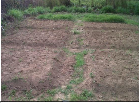
a. Pembuatan Bedangan