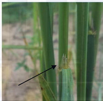
e. Bentuk lidah (2-Cleft )