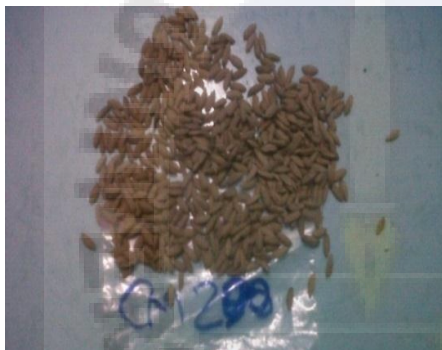
c. Cerak Madu 200