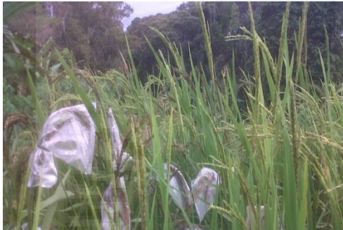
c. Penyungkupan Malai Padi