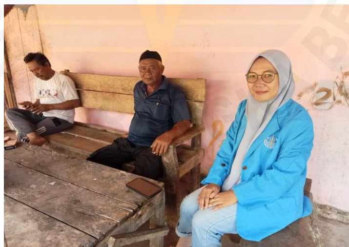
Wawancara dengan Bapak Tukiran