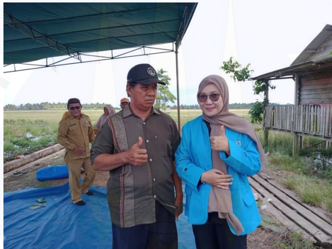
Wawancara dengan Bapak Tahang