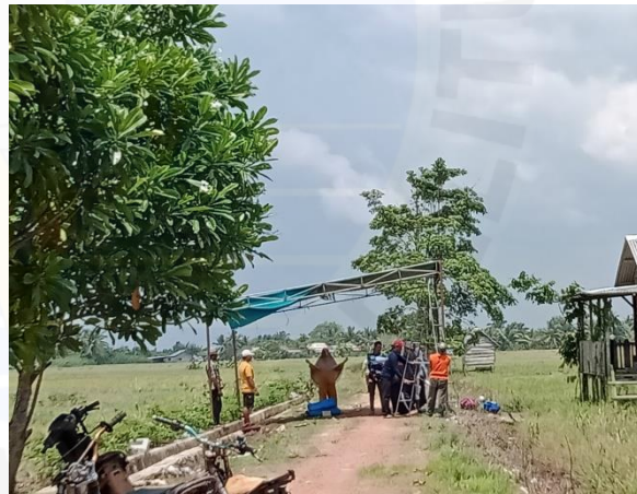
Kerja Bakti Petani Membersihkan Lokasi Sedekah Bumi