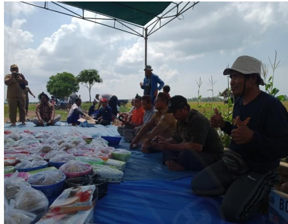
Perayaan Sedekah Bumi di Desa Rias