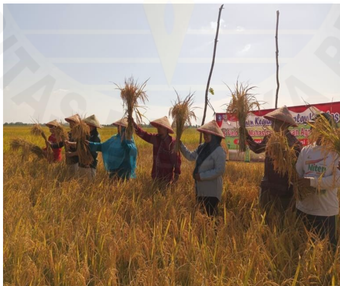
Panen bibit yang di kelola kelompok tani