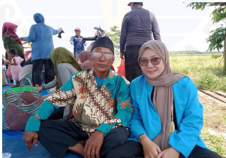
Wawancara dengan Bapak Har