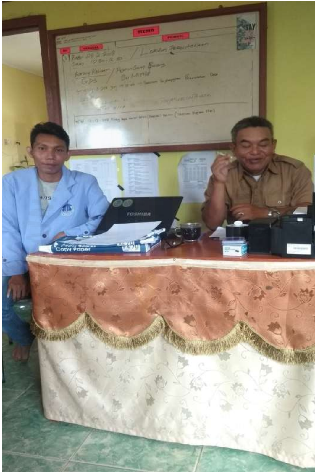
Foto Bersama Kepala Desa Mempaya