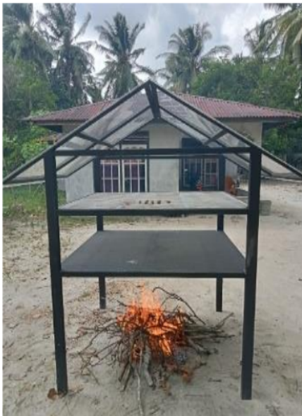
Gambar 4. Pengeringan teripang menggunakan alat pengering hybrid.