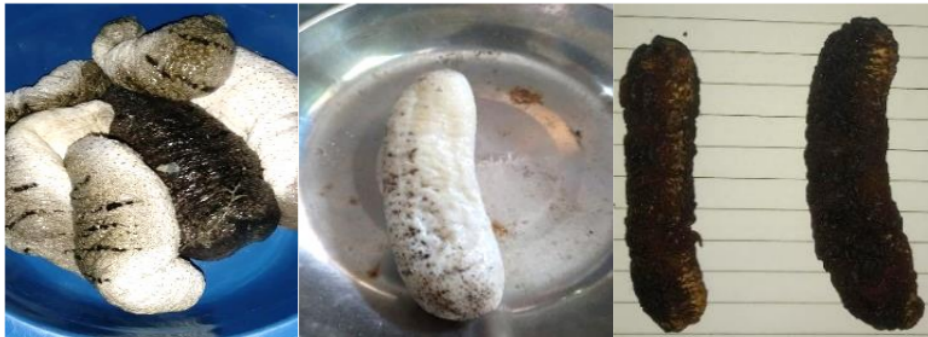
Gambar 3. Tampilan Teripang sebelum dibersihkan (kiri), Teripang setelah dibersihkan (tengah) dan Teripang setelah proses pengeringan (kanan)