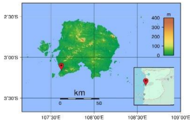
Gambar 1. Lokasi penelitian di Desa Dukong, Kec. Simpang Pesak, Kabupaten Belitung

Masyarakat Desa Dukong di Kabupaten Belitung telah mengembangkan budidaya Teripang. Hasil panennya memerlukan pengeringan untuk memudahkan distribusi dan pemasarannya. Dalam upaya membantu masyarakat Desa Dukong mengolah Teripang kering dilaksanakan riset ini untuk mengkonstruksikan alat pengering hybrid yang aplikatif diterapkan.