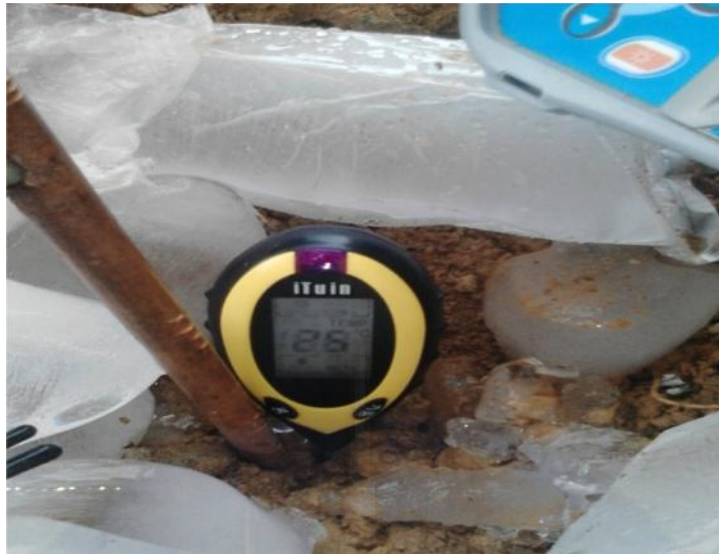
Gambar Proses Pengukuran Suhu