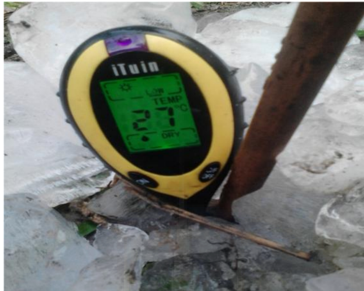
Gambar Proses Pengukuran Suhu

Pengukuran Tahanan Pentanahan Jenis Tanah Pinggiran sungai