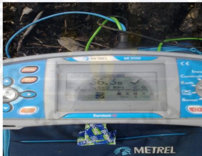
Gambar Proses pengukuran Tahanan Pentanahan