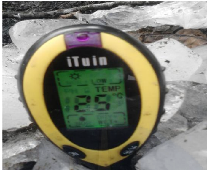
Gambar Proses Pengukuran Suhu