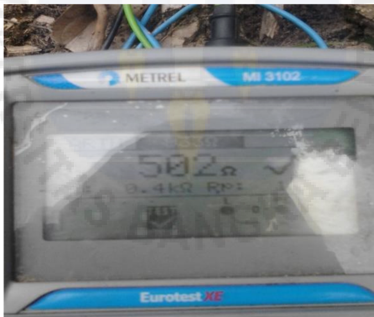
Gambar Proses pengukuran Tahanan Pentanahan