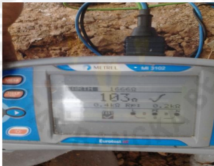
Gambar Proses pengukuran Tahanan Pentanahan