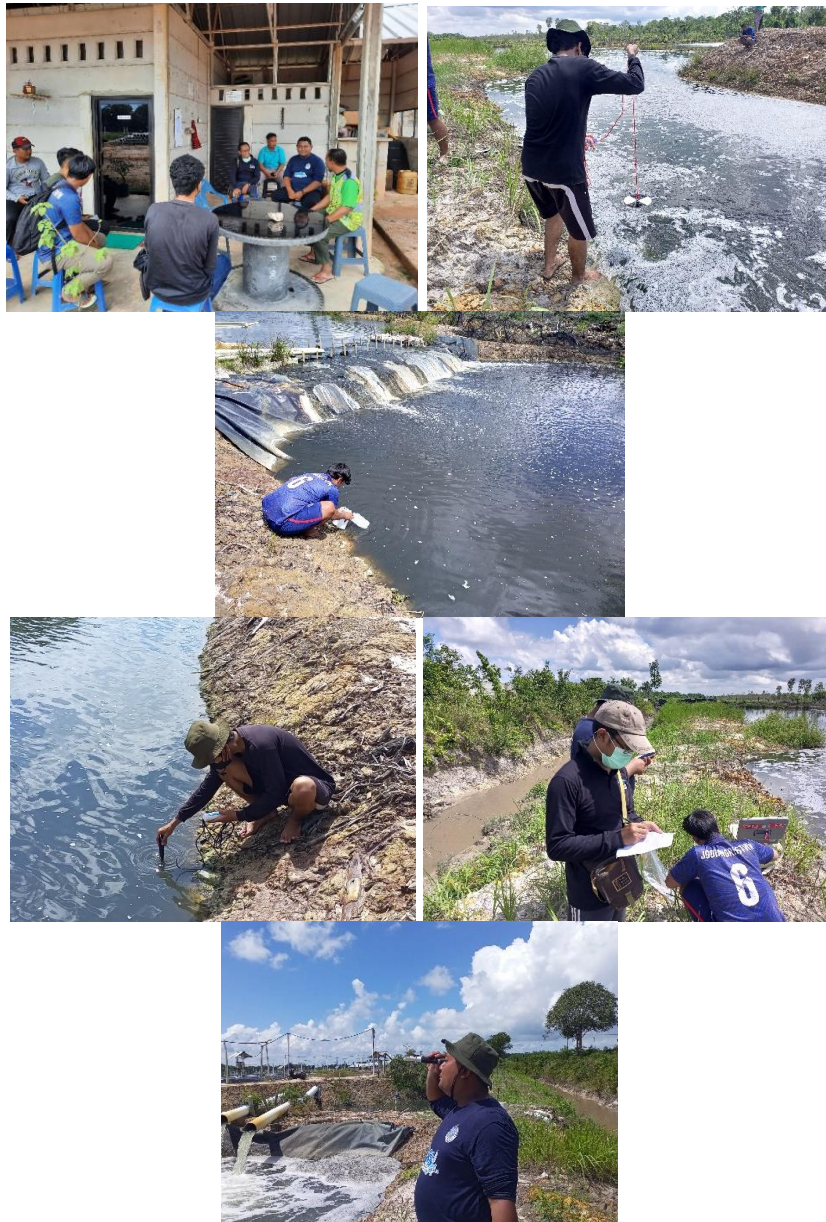
CV. Rajawali Tukak Sadai