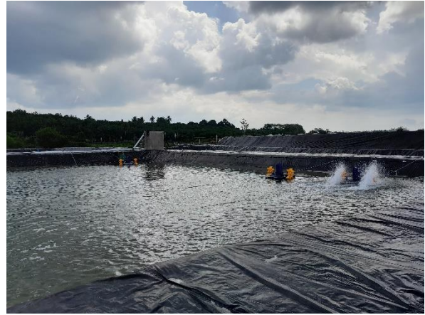
Tambak Udang PT Samudera Bangka Sejahtera