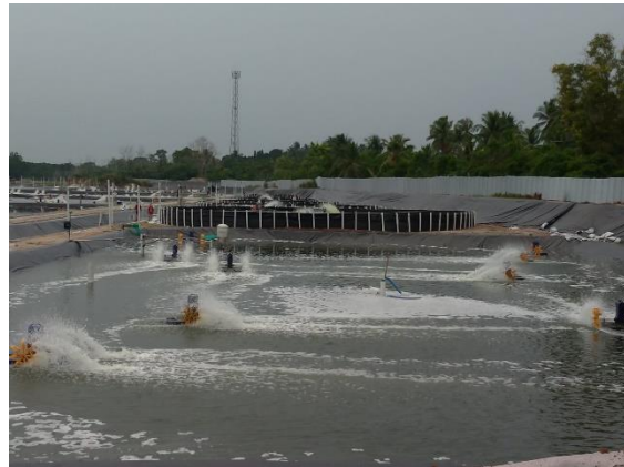
Pengambilan Sampel Air Tambak (Inlet, IPAL, dan Outlet)