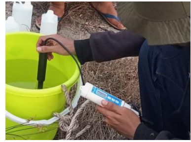
PT. Bangka Belitung Maritim Sejahtera