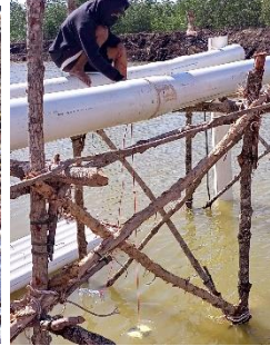
PT. Anugerah Bangka Sejahtera