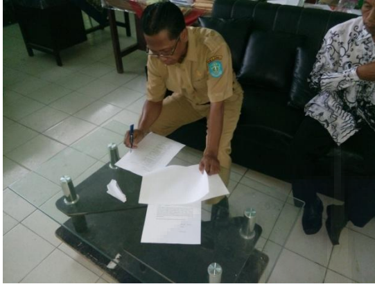
Foto Guru-guru SMP Negeri 5 Sungailiat sedang mengisi kuesioner