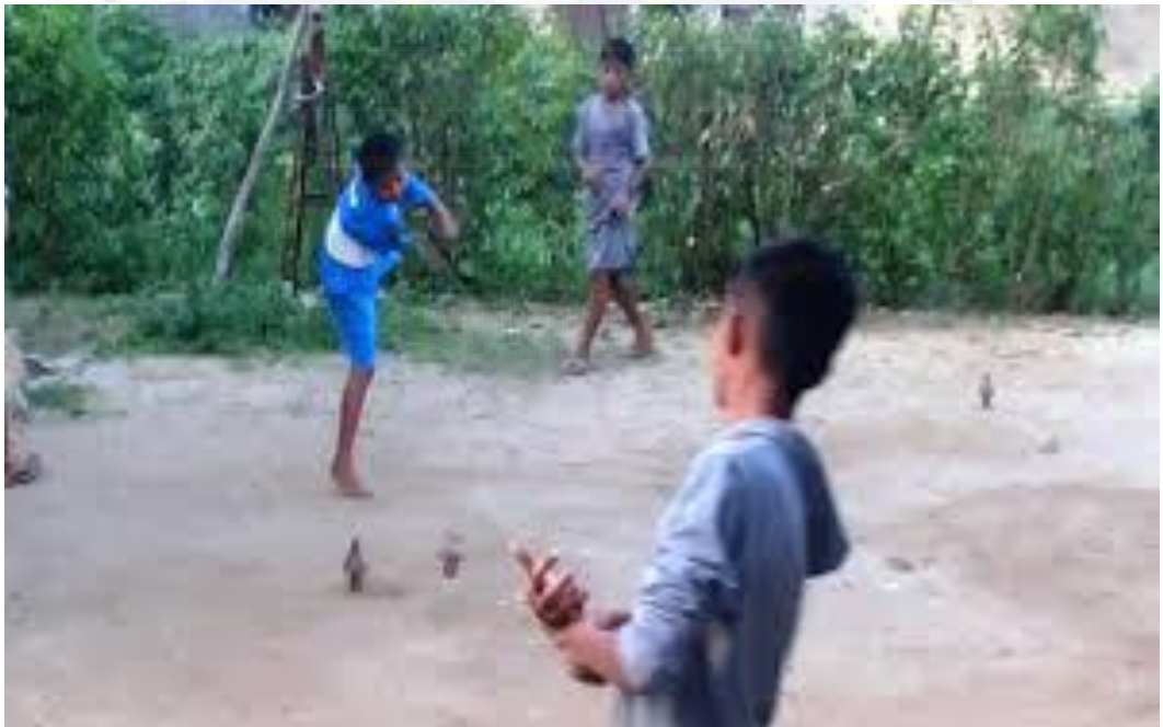
Gambar 3. Diambil saat anak-anak memainkan permainan gasing