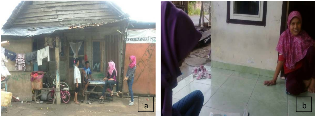
Gambar 4 a dan b. Wawancara Responden