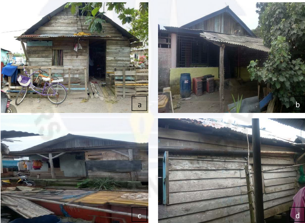
Gambar 5 a,b, c, dan d. Keadaan Rumah Responden