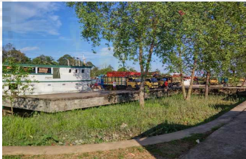
Gambar 2. Pemuatan Barang ke Mobil Truk