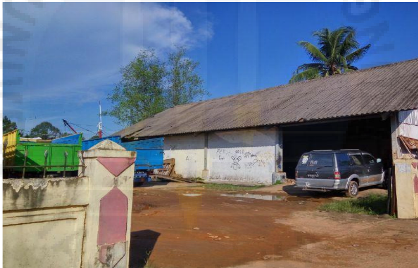
Gambar 4. Gudang Barang Sementara di Pelabuhan Sungaiselan