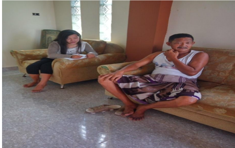
Gambar 3. Wawancara dengan Ketua IKSS