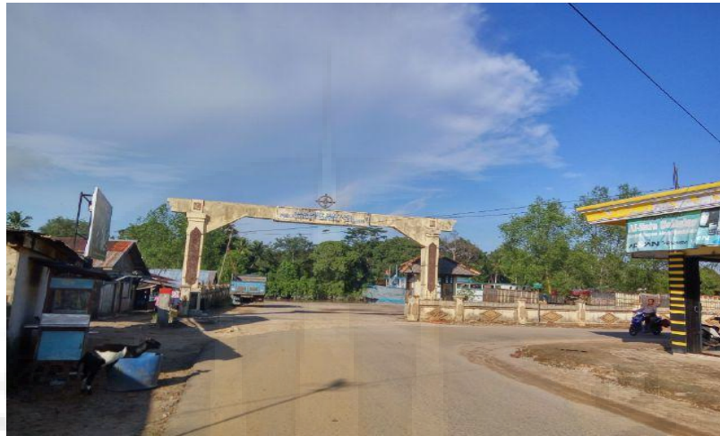
Gambar 1. Pintu Masuk Pelabuhan Sungaiselan