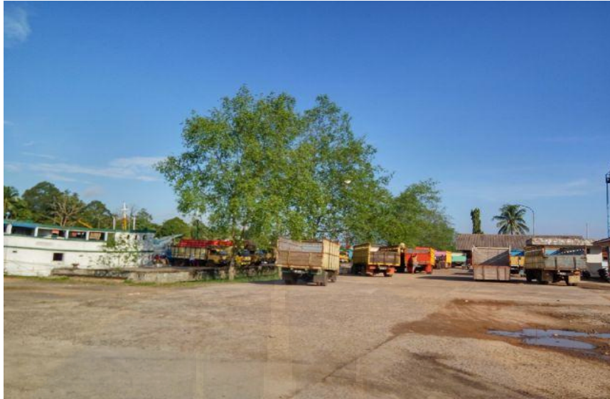
Gambar 5. Mobil yang Sedang Menunggu Antrian Pemuatan Barang