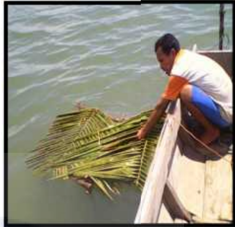
Setting Alat Tangkap Bubu