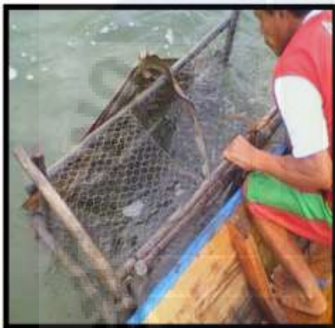
Hauling Alat Tangkap Bubu