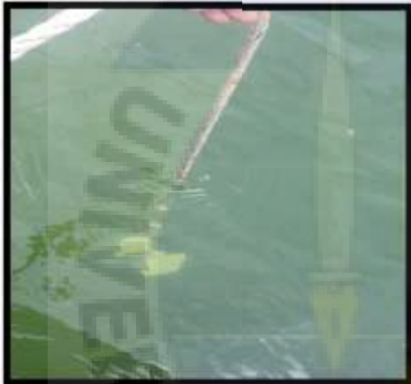
Pengukuran Kecerahan Perairan