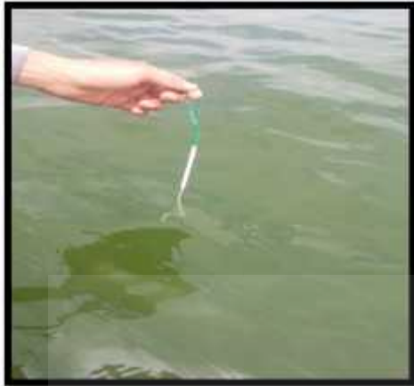
Pengukuran Suhu Perairan