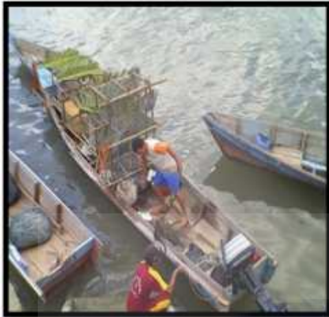
Keberangkatan Menuju Lokasi Penelitian