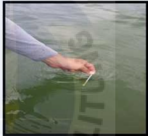
Pengukuran pH Perairan