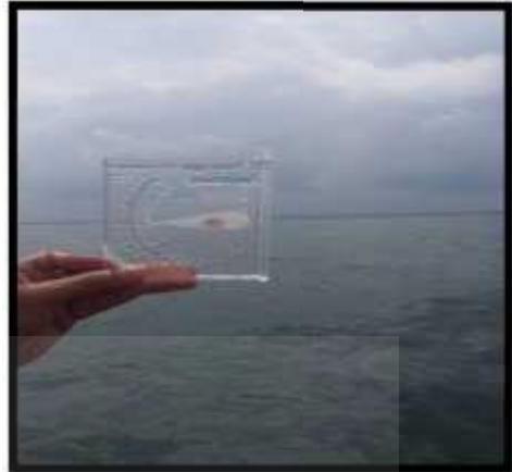
Pengukuran Salinitas Perairan