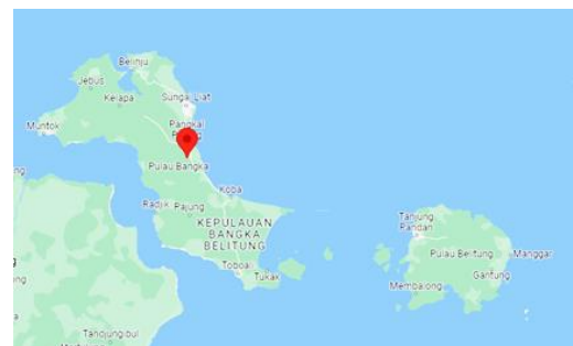
Gambar 1. Lokasi Desa Air Mesu, Bangka Tengah

Penelitian ini dilaksanakan pada bulan Maret sampai dengan Mei tahun 2022. Lokasi penelitian ini dilakukan di Desa Air Mesu, Kecamatan Pangkalan Baru Kabupaten Bangka Tengah (Gambar 1). Pemilihan lokasi penelitian dilakukan dengan melihat dari tempat pembudidaya di Desa Air Mesu memiliki sentra produksi Ikan Nila dengan KJA di kolong dan kolam tanah. Alat dan bahan pada penelitian ini yaitu alat tulis, DO meter, pH meter, thermometer, kamera, kuesioner, dan laptop.