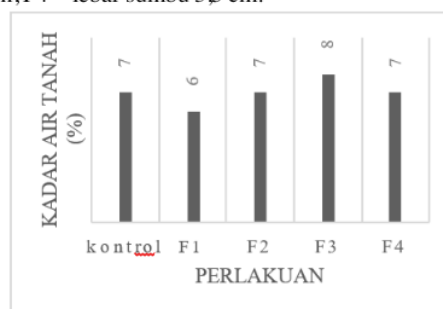
Gambar 3. Grafik rerata kadar air tanah

Kadar air tanah pada media tailing lebar sumbu 0,5 cm lebih rendah dibandingkan dengan media tailing lebar sumbu lainnya maupun pada media tailing penyiraman secara langsung. Keterangan : F0 = penyiraman secara langsung, F1=lebar sumbu 0,5 cm, F2= lebar sumbu 1,5 cm, F3=lebar sumbu 2,5 cm, F4 = lebar sumbu 3,5 cm.