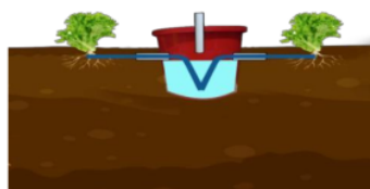
Gambar 1. Instalasi sistem irigasi growick di lapangan

Penelitian ini dilakukan menggunakan metode eksperimental dengan Rancangan Acak Lengkap (RAL) dengan perlakuan lebar sumbu kain flanel yang terdiri dari 5 taraf perlakuan, perlakuan yang digunakan F0 : penyiraman secara langsung, F1 : lebar sumbu 0,5 cm, F2 : lebar sumbu 1,5 cm, F3 : lebar sumbu 2,5 cm, F4: lebar sumbu 3,5 cm. Setiap taraf perlakuan terdiri dari 3 ulangan, sehingga terdapat 15 unit percobaan. Setiap unit percobaan terdiri dari 12 populasi dan 6 jumlah sampel tanaman selada.