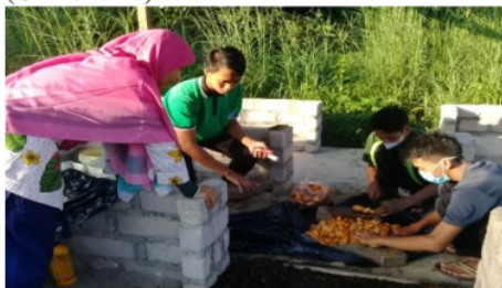
Gambar 10. Pencacahan Limbah Jeruk.

Langkah-langkah pembuatan MOL limbah Jeruk ini dapat dikatakan sangat simpel, yaitu dengan mempersiapkan peralatan yang akan digunakan, pencarian bahan-bahan, pencacahan limbah Jeruk, pencampuran semua bahan, fermentasi (ember tertutup), dan pengemasan ke dalam botol (1 L), dan aplikasi MOL ke tanaman. Alat yang digunakan antara lain, ember cat yang berukuran 25 L, plastik hitam dan tali rapia. Bahan utama yang disiapkan adalah Limbah buah Jeruk sebanyak 20 kg/sesuai kebutuhan. Pencacahan dilakukan bertujuan memperkecil ukuran Jeruk sehingga, mempercepat proses ekstraksi limbah Jeruknya. Pencacahan limbah Jeruk dilakukan secara manual, yaitu dengan memotong Jeruk menjadi beberapa bagian menggunakan pisau/parang (Gambar 10).