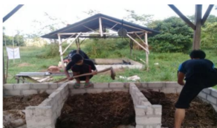
Gambar 4. Pencampuran Bahan Kompos.