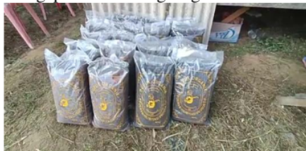
Gambar 9. Produk Kompos Jerami Padi.

Setelah kompos dikering anginkan dan suhu mulai menurun, selanjutnya kompos di lakukan penyaringan/ pengayakan, hal tersebut bertujuan untuk menghancurkan kompos menjadi lebih kecil atau tidak menggumpal. Selanjutnya adalah pengemasakan kompos ke dalam plastik, dengan berat kompos seberat 4 kg/plastik (Gambar 9). Aplikasi kompos dapat dilakukan dengan mengaplikasikan langsung ke tanah.