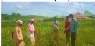
Gambar 2. Pencarian Jerami Padi untuk Bahan Kompos.

Tahapan selanjutnya, yaitu persiapan bahan. Bahan-bahan utama yang digunakan dalam pembuatan kompos antara lain adalah jerami padi, kotoran hewan (ayam/sapi/kambing/domba atau kuda), dan aktivator kompos (bisa menggunakan EM-4). Pencarian jerami padi disekitaran lahan bekas penanaman tanaman padi (Gambar 2).