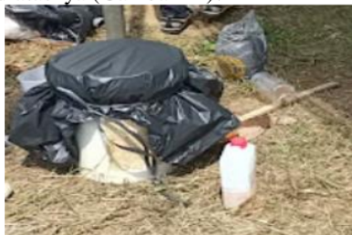
Gambar 11. Penutupan MOL Limbah Jeruk.

agar proses dekomposisi bahan organik tidak membutuhkan waktu yang terlalu lama. Langkah selanjutnya setelah pencacahan adalah pencampuran semua bahan (Limbah jeruk, air cucian beras, dan gula merah). Setelah tercampur semua bahan baku utama dan bahan tambahan lainnya, kemudian ember ditutup menggunakan tutup ember yang dilapisi dengan plastik hitam di atasnya (Gambar 11).