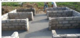
Gambar 1. Proses Pembuatan Rumah Kompos.

tahun 2021, di Lahan Kebun Percobaan dan Penelitian (KP2) Universitas Bangka Belitung. Pembuatan kompos dan MOL dilaksanakan di rumah kompos khusus di desain untuk pembuatan kompos. Tahap-tahapan pembuatan kompos dari jerami yaitu: Persiapan bahan, pencacahan bahan, pencampuran bahan, pengomposan, pembalikan, pemanenan dan aplikasi kompos. Tahapan pertama yang dilakukan dalam proses pembuatan kompos dari jerami padi adalah pembuatan rumah kompos yang akan digunakan untuk mempermudah pembuatan kompos (Gambar 1).