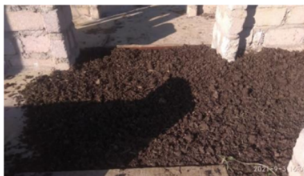
Gambar 8. Penjemuran Kompos di Bawah Sinar Matahari.

Setelah kompos dikering anginkan dan suhu mulai menurun, selanjutnya kompos di lakukan penyaringan/ pengayakan, hal tersebut bertujuan untuk menghancurkan kompos menjadi lebih kecil atau tidak menggumpal. Selanjutnya adalah pengemasakan kompos ke dalam plastik, dengan berat kompos seberat 4 kg/plastik (Gambar 9). Aplikasi kompos dapat dilakukan dengan mengaplikasikan langsung ke tanah.