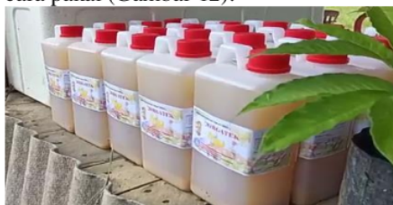
Gambar 12. Produk MOL Limbah Jeruk.

MOL di diamkan selama kurang lebih 7 hari. MOL sudah dapat di panen pada hari setelahnya (8 hari). Proses pembuatan MOL tidak membutuhkan waktu yang lama, sebab semakin lama proses pendiaman MOL maka bakteri yang dihasilkan sudah tidak banyak lagi/mati. Larutan MOL di saring terlebih dahulu agar sisa-sisa limbah tidak terikut pada saat pengemasan ke dalam botol. MOL di masukkan ke dalam botol menggunakan corong, kemudian di tutup rapat dan ditempelkan label produk lengkap dengan keterangan cara pakai (Gambar 12).