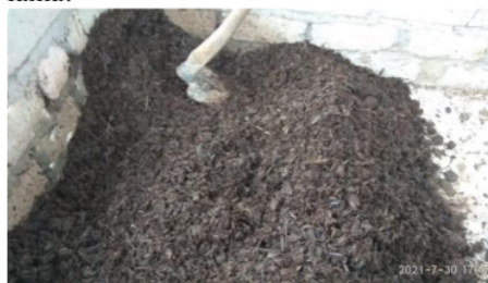
Gambar 7. Pengecekan Kondisi Kompos sebelum di Panen.

Tahapan terakhir yaitu proses pemanenan. Kompos yang siap panen dapat dilihat dari warna kompos yang telah menggelap, strukturnya yang remah, berbau tanah dan tidak terlalu panas jika dipegang (Gambar 7.). Waktu pematangan kompos beragam, perbedaan jenis dan bahan dasar pembuatan kompos akan membuat waktu panen berbeda. Umumnya, semakin keras dan semakin besar tumpukan kompos akan menyebabkan waktu pematangan kompos semakin lama.