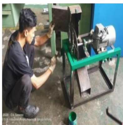
Gambar 3. Foto Proses Pencacahan Jerami Padi secara Manual (kiri) dan Mesin Pencacah (kanan).

Proses selanjutnya, yaitu pencampuran bahan. Bahan-bahan yang sudah disiapkan, yaitu potongan jerami padi dan kotoran hewan dicampur menjadi satu. Tidak ada perbandingan komposisi yang baku tentang banyaknya perbandingan jerami padi dan kotoran hewan yang digunakan dalam pembuatan kompos. Bahan yang sudah dicampur, kemudian diaduk sampai rata. Bahan kompos yang sudah diaduk, kemudian dilembabkan dengan cara disiram dengan air dan larutan EM-4 (Gambar 4).