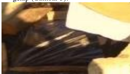
Gambar 5. Kompos di Tutup Menggunakan Plastik Hitam.

Semua bahan yang telah dicampurkan dengan rata, kemudian masuk ke tahapan selanjutnya, yaitu proses pengomposan. Proses pengomposan dapat menggunakan berbagai macam metode, seperti dumb compost , compost bin , atau rotary composting . Proses pengomposan yang tidak menggunakan wadah tertutup, dapat digantikan dengan cara ditutup atau dibungkus dengan terpal atau menggunakan plastik berwarna gelap (Gambar 5).