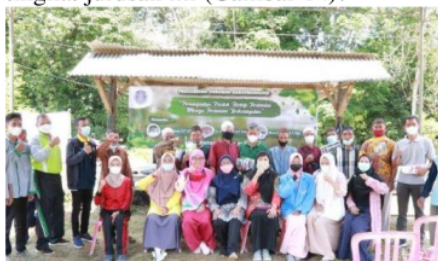
Gambar 14. Foto Bersama pada Kegiatan PMTJ.

Peserta pengabdian memberikan antusias yang cukup tinggi terhadap diadakannya kegiatan ini di Desa Balunujuk. Pada sesi tanya jawab, peserta menanyakan perihal pemanfaatan limbah di Desa Balunujuk, aplikasi pupuk organik pada tanaman porang.lama waktu pembuatan MOL dan media yang sesuai untuk budidaya tanaman porang. Anggota kelompok tani yang hadir juga berperan aktif dalam kegiatan pengabdian masyarakat tingkat jurusan ini (Gambar 14).