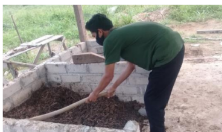
Gambar 6. Proses Pembalikan Kompos.

Semua bahan yang telah dicampurkan dengan rata, kemudian masuk ke tahapan selanjutnya, yaitu proses pengomposan. Proses pengomposan dapat menggunakan berbagai macam metode, seperti dumb compost , compost bin , atau rotary composting . Proses pengomposan yang tidak menggunakan wadah tertutup, dapat digantikan dengan cara ditutup atau dibungkus dengan terpal atau menggunakan plastik berwarna gelap (Gambar 5).