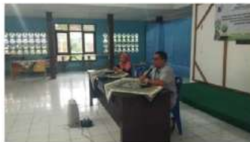
Gambar 1 Sosialisasi budi daya tanaman dengan sistem hidroponik.

Hidroponik adalah cara bercocok tanam tanpa tanah tetapi menggunakan air dengan pemberian unsur hara terkendali yang berisi unsur-unsur esensial yang dibutuhkan untuk pertumbuhan tanaman (Siswandi & Yuwono 2015). Tanaman