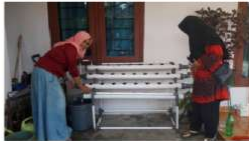
Gambar 3 Pemindahan bibit dari nampan semai ke dalam instalasi pipa.