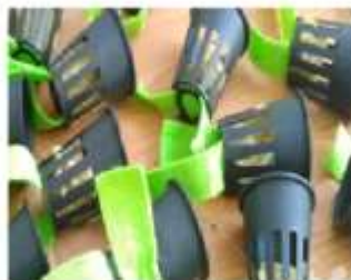
Gambar 2 Rangkaian instalasi pipa paralon dan netpot.