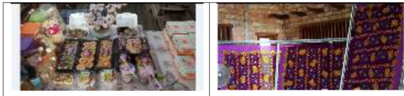
Gambar 1. Hasil produk anggota PKK Kace Timur

Propinsi Kepulauan Bangka Belitung merupakan daerah kepulauan sehingga menjadi tempat tujuan wisata ( destination tourism ) yang sangat potensial karena memiliki banyak objek wisata yang menjanjikan untuk dikunjungi oleh wisatawan. Untuk menambah daya tarik wisatawan untuk datang berkunjung ke pulau Bangka ada hal lain yang perlu diperhatikan adalah hasil produk lokal yang dapat dinikmati oleh wisatawan. Salah satu mitra yang akan dijadikan tempat pengabdian di skema tingkat Fakultas adalah ibu-ibu PKK yang ada di Kace Timur. Ibu-ibu PKK memiliki anggota yang beragam hasil usaha seperti batik, kue Bangka, otak-otak dan lain-lain. Berikut ini adalah gambar dari produk yang dihasilkan :