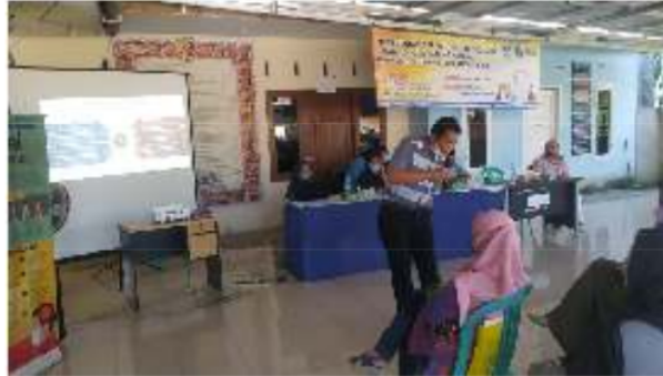
Gambar 1. Pelatihan dan Pendampingan 7”S

4) Jika belum mampu, segera berbenah diri