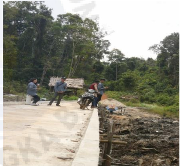
Gambar: kondisi di dermaga