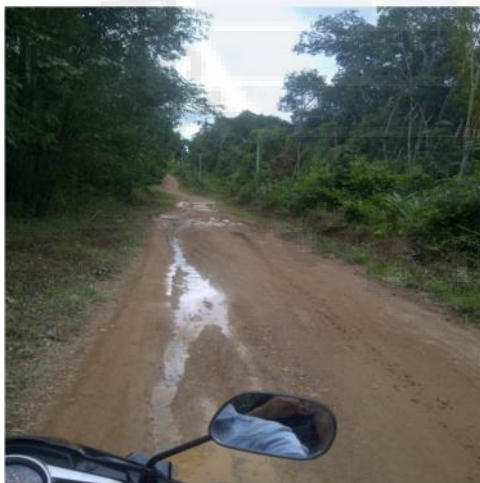
Gambar : Jalan yang menghubungkan antara Dusun Bukit Tulang dengan Jalan Raya Belinyu.