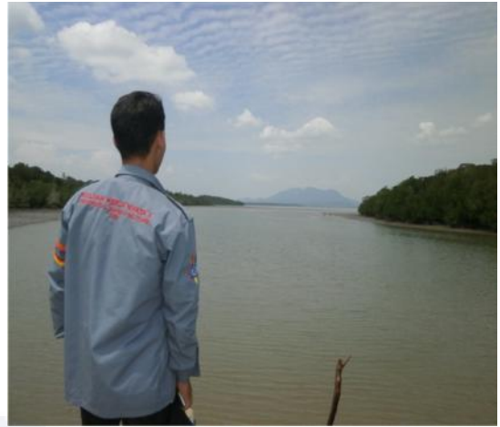
Gambar: peneliti di wilayah pelabuhan dekat pulau Dante Bukit Tulang.