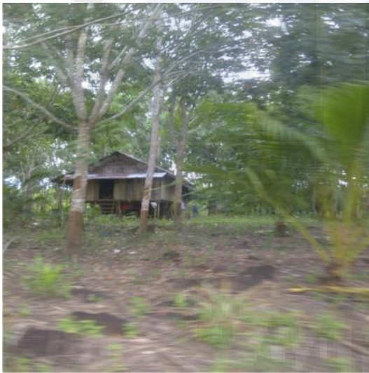
Gambar : salah satu rumah dekat dengan perkebunan karet.