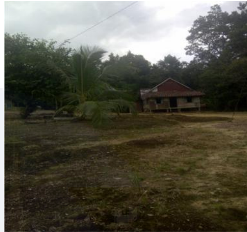
gambar : Salah satu potret pemukiman yang ada di Dusun Bukit Tulang