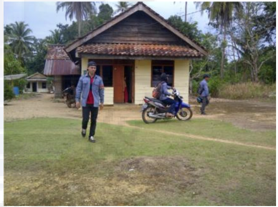
Gambar : Peneliti di RT Pudak