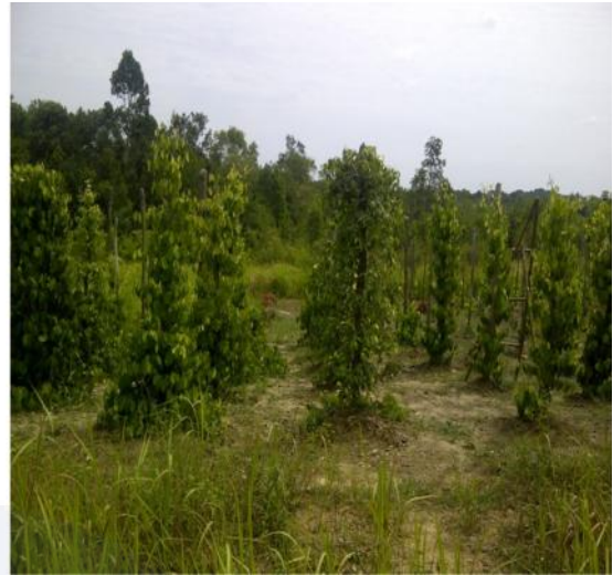
Gambar : perkebunan lada milik warga di Dusun Bukit Tulang.