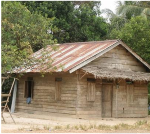
Gambar : salah satu Potret rumah yang ada di Dusun Bukit Tulang.