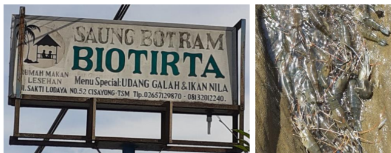
Gambar 5. Pemasaran Langsung di Restoran Biotirta

Mengenai panen udang galah dapat diasumsikan jika tebar benur 1.000 ekor dengan padat tebar 50 ekor/m 2 maka ketika sortir (3 bulan) dapat panen bertahap sekitar 15 kg untuk konsumsi. Sisa sortiran sekitar 5 kg dengan waktu sekitar 3 bulan lagi bisa dipanen sehingga total panen sekitar 20 kg dalam 6 bulan. Dengan perhitungan mortalitas 20% dari 1.000 ekor maka dari udang yang hidup sebanyak 800 ekor dengan size 35-40 ekor/kg diperoleh 20 kg. Harga udang saat panen 73.000/kg di masyarakat atau petani, dipanen sendiri di kolam oleh pembeli atau tengkulak. Tengkulak tinggal timbang di wadah keramba dengan harga di petani sebesar Rp 75.000/kg, atau sampai di konsumen dengan harga sekitar Rp 100.000/kg dari pengecer.