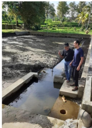
Gambar 4. Kolam Pembesaran Udang Galah

Konstruksi kolam harus dibuat dengan kemiringan tertentu, dasar kolam semakin dalam ke arah saluran pembuangan air (Gambar 4). Perlu jaring untuk kebutuhan panen yang disimpan di dekat pembuangan air agar udang terbawa hanyut dan masuk ke dalam jaring, biasanya udang berkumpul mencari tempat yang lebih dalam. Adanya tembok beton di dekat saluran pembuangan merupakan hal yang lebih baik dan memudahkan saat pemanenan. Perpipaan untuk saluran air setiap kolam dibuat seefektif mungkin dan tidak tercampur antara air baru dengan air yang sudah terpakai. Sebaiknya setiap konstruksi kolam memiliki input air baru semuanya. Luas kolam idealnya dapat dibuat dengan ukuran 40 m x 25 m namun jika memiliki lahan yang sempit dapat dibuat sekitar 20 m x 15 m atau 15 m x 10 m. Lahan kolam dengan kedalaman air 0,5 - 0,8 m merupakan kedalaman yang ideal dalam pembesaran udang.