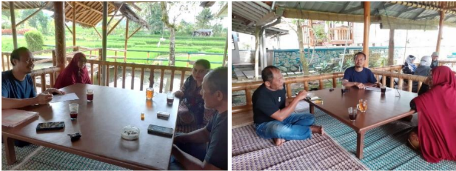
Gambar 2. Kelompok Tani Biotirta dan Udang Galah

Belitung ke Poktan Biotirta di Kecamatan Cisayong Kabupaten Tasikmalaya Jawa barat. Konsep yang diusung oleh Poktan Biotirta yaitu budidaya udang galah mulai dari hal teknis pembesaran udang di kolam hingga pemasaran. Hal ini menjadi keunggulan Poktan Biotirta sehingga dapat menjadi inspirasi bagi kegiatan kewirausahaan. Pertumbuhan ekonomi yang baik di masyarakat sebenarnya harus digerakan oleh kegiatan kewirausahaan yang dominan baik skala UMKM hingga level perusahaan besar atau corporate. Pertumbuhan ekonomi di suatu wilayah yang belum terbangun pada bidang perikanan dapat mencontoh kegiatan usaha seperti yang dilakukan Poktan Biotirta. Wawancara dan kunjungan langsung ke lapangan dapat dilihat seperti pada Gambar 2 dan Gambar 3.