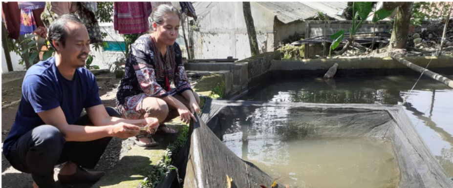
Gambar 3. Keramba Jaring Apung Udang Galah

Pengetahuan yang diperoleh dari kegiatan studi banding ini adalah alih pengetahuan mengenai pembesaran udang galah mulai dari persiapan lahan budidaya, konstruksi kolam, tanggul, kualitas air, benur dan pembesaran, pakan, panen, hingga pemasaran. Setiap tahapan dapat diuraikan sebagai berikut: