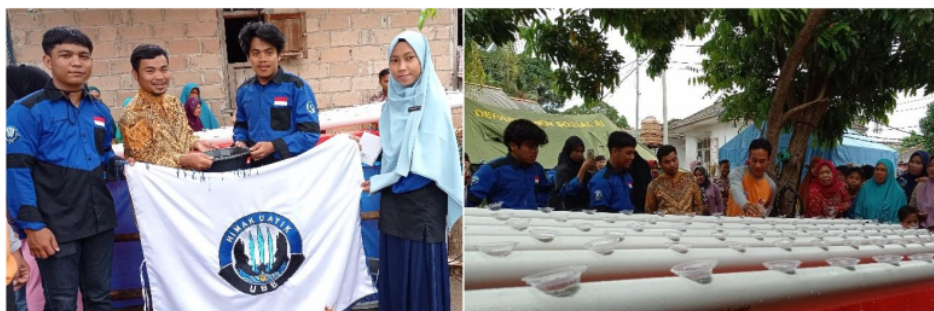
Gambar 4. Penyerahan secara simbolis demplot akuaponik kepada tokoh masyarakat dan penjelasan penggunaan akuaponik kepada masyarakat

minat dalam mengembangkan akuaponik. Setidaknya memberikan peningkatan pengetahuan tentang akuaponik (Zubaidah et al. , 2020).