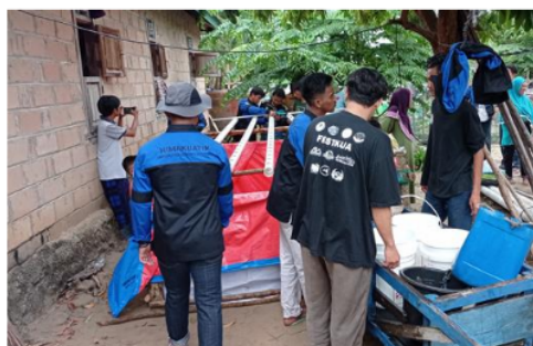
Gambar 3. Perakitan sistem akuaponik

Peralatan konstruksi akuaponik yang telah dipersiapkan, selanjutnya dirakit di salah satu pekarangan rumah warga yang memiliki akses listrik dan dekat jalur utama dalam Dusun Pulau Panjang (Gambar 3). Proses perakitan dilakukan bersama warga. Meskipun sebagian warga hanya melihat, hal ini diapresiasi sebagai keingintahuan masyarakat terhadap pengetahuan baru. Ikut sertanya masyarakat dalam pembuatan konstruksi akuaponik ini memperkuat keberlanjutan akuaponik, karena melalui partisipasi memberikan pemahaman lebih tinggi (Hertika et al. , 2021). Keingintahuan masyarakat juga dipahami karena akuaponik merupakan pengetahuan baru bagi masyarakat Pulau Panjang. Akuaponik sebenarnya bukan sistem baru di Indonesia. Modifikasinya telah berkembang luas dan bahkan menjadi model untuk sistem yang berkelanjutan (Sungkar, 2015). Namun masih banyak masyarakat yang belum memperoleh pengetahuan tentang sistem ini sehingga menjadi hal yang baru bagi mereka (Delis, 2021).