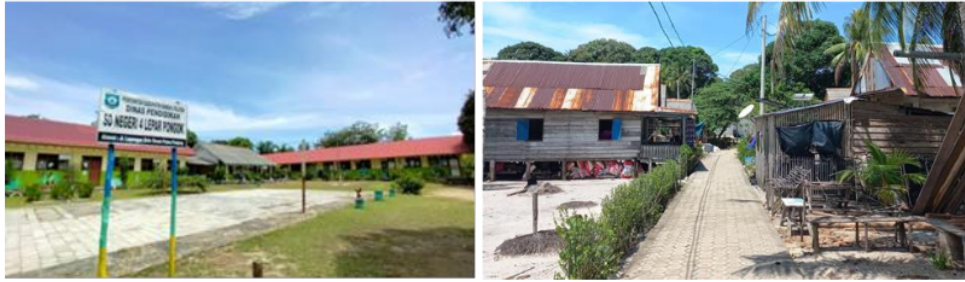
Gambar 3. SD Negeri di Pulau Panjang (kiri) dan kondisi perkampungannya