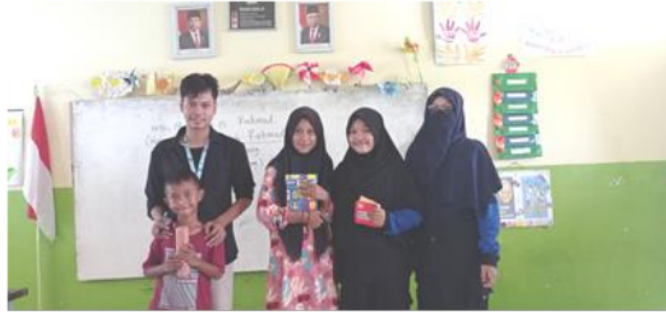
Gambar 6. Pemberian reward dalam pembelajaran Bahasa Inggris di kelas