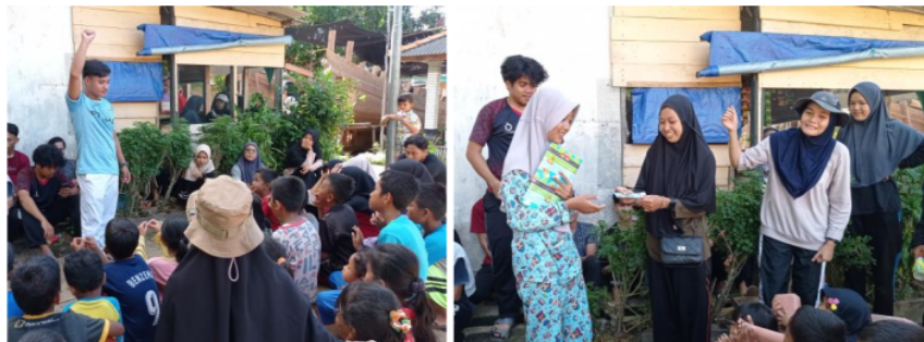
Gambar 9. Pemberian reward untuk kegiatan outdoor

Kegiatan-kegiatan bersama anak-anak Pulau Panjang memiliki waktu yang terlalu singkat untuk dapat dinilai keberhasilannya dalam membangun minat belajar. Meski demikian, pengabdian meyakini pembelajaran Bahasa Inggris, mengaji bersama di masjid, dan edukasi model sekolah alam memberikan kesan positif bagi anak-anak untuk lebih semangat belajar. Ketakutan tentang pelajaran yang sulit menjadi mudah dipahami saat anak-anak termotivasi untuk memahami melalui permainan dan pemberian reward . Semoga sedikit yang kami lakukan bagi warga Pulau Panjang ini bisa bermanfaat dalam perkembangan kognitif dan afektif anak. Besar harapan peran orang tua, guru dan lingkungan dapat mendukung mereka menjadi pejuang pemberani mengarungi lautan pengetahuan.