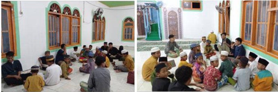
Gambar 7. Merintis Tempat Pendidikan Al-Quran

Edukasi model sekolah alam kepada anak-anak usia sekolah dilakukan di luar ruangan yaitu pada lapangan berumput di sekitar lokasi sekolah. Implementasi penyampaian edukasi dilakukan dalam bentuk permainan diantaranya adalah uji kreativitas dan imajinasi menggambar dari angka yang disediakan yang selanjutnya diikuti anak-anak melanjutkan sesuai hal yang terlintas dipikiran mereka. Penerapan 5S yakni Senyum, Sapa, Salam, Sopan dan Santun, serta aksi bersih sampah plastik juga menjadi topik edukasi yang disampaikan dengan dibalut permainan anak-anak sehingga menciptakan generasi yang menjaga dan melestarikan keindahan alam.