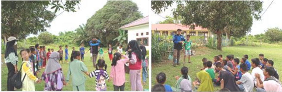
Gambar 8. Pelaksanaan Sekolah Alam