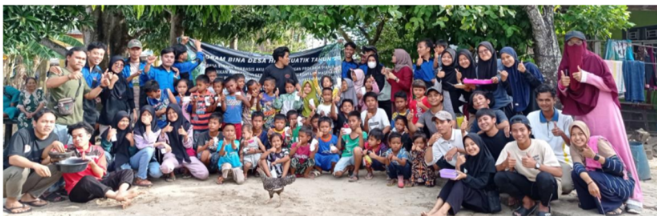
Gambar 10. Perpisahan dengan anak-anak Pulau Panjang

Kegiatan-kegiatan bersama anak-anak Pulau Panjang memiliki waktu yang terlalu singkat untuk dapat dinilai keberhasilannya dalam membangun minat belajar. Meski demikian, pengabdian meyakini pembelajaran Bahasa Inggris, mengaji bersama di masjid, dan edukasi model sekolah alam memberikan kesan positif bagi anak-anak untuk lebih semangat belajar. Ketakutan tentang pelajaran yang sulit menjadi mudah dipahami saat anak-anak termotivasi untuk memahami melalui permainan dan pemberian reward . Semoga sedikit yang kami lakukan bagi warga Pulau Panjang ini bisa bermanfaat dalam perkembangan kognitif dan afektif anak. Besar harapan peran orang tua, guru dan lingkungan dapat mendukung mereka menjadi pejuang pemberani mengarungi lautan pengetahuan.