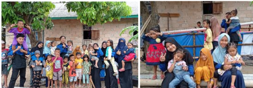
Gambar 4. Pendekatan mahasiswa kepada anak-anak di Pulau Panjang

Pada kegiatan bina desa ini, mahasiswa berupaya mengawali dengan kedekatan dengan masyarakat target yaitu anak-anak usia sekolah dasar. Anak-anak mulai mendekat dengan tim bina desa sejak tim sampai di lokasi pengabdian. Hubungan kedekatan antara mahasiswa dan anak-anak mulai terbangun dengan saling mengenal dan bermain bersama (Gambar 4). Hubungan dekat ini memudahkan komunikasi antara tim pengabdian dan anak-anak sebagai target pengabdian. Komunikasi yang terjadi memunculkan saling memahami antara keduanya sehingga mahasiswa sebagai pengajar dapat mengatur interaksinya dengan anak-anak untuk mencapai terbangunnya motivasi dan minat belajar. Komunikasi saling memahami ini berperan dalam interaksi antara pengajar dan siswa (Inah, 2015). Perkenalan ini juga menjadi proses adaptasi antara pengabdian dengan anak-anak di Pulau Panjang. Kondisi sosial yang berbeda memerlukan penyesuaian agar kegiatan yang direncanakan lebih mudah diterima. Pengajar dan peserta didik yang mengalami kondisi sosial berbeda memerlukan proses adaptasi (Rohmawati dan Amirudin, 2022).