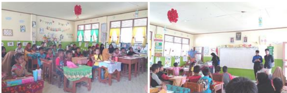
Gambar 5. Pembelajaran Bahasa Inggris di kelas

proses belajar dilakukan diluar jam pelajaran. Tempat pelaksanaan belajar bahasa Inggris dilakukan di kelas SD Negeri 4 Lepar Pongok. Hubungan baik yang telah terjalin antara anak-anak dan mahasiswa membuat banyaknya anak yang hadir dan ingin belajar (Gambar 5). Bahasa Inggris yang mereka khawatirkan sulit untuk dipelajari, dapat dengan mudah mereka coba dalam kegiatan ini. Bahasa Inggris disampaikan sebagai bukan merupakan bahasa yang sulit dipelajari dan sangat diperlukan bersaing di era global. Minat belajar Bahasa Inggris perlu dilakukan sejak usia dini agar ketakutan terhadap bahasa asing ini bisa diminimalisir sejak dini (Asmin, 2013). Menumbuhkan minat belajar Bahasa Inggris di pulau terpencil membutuhkan upaya yang lebih besar. Perlu metode yang mudah dan menarik untuk membangun minatnya. Kondisi ini dimungkinkan mirip dengan penumbuhan minat belajar Bahasa Inggris di daerah pelosok Indonesia lainnya seperti di wilayah perbatasan. Lumbantobing dan Sadewo (2022) menggunakan aplikasi “English for Kids” untuk menarik minat siswa siswi pada perbatasan Indonesia di Kalimantan Barat agar tertarik belajar Bahasa Inggris.