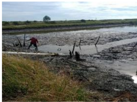
Gambar 1. Proses persiapan olam pendederan Ikan Bandeng