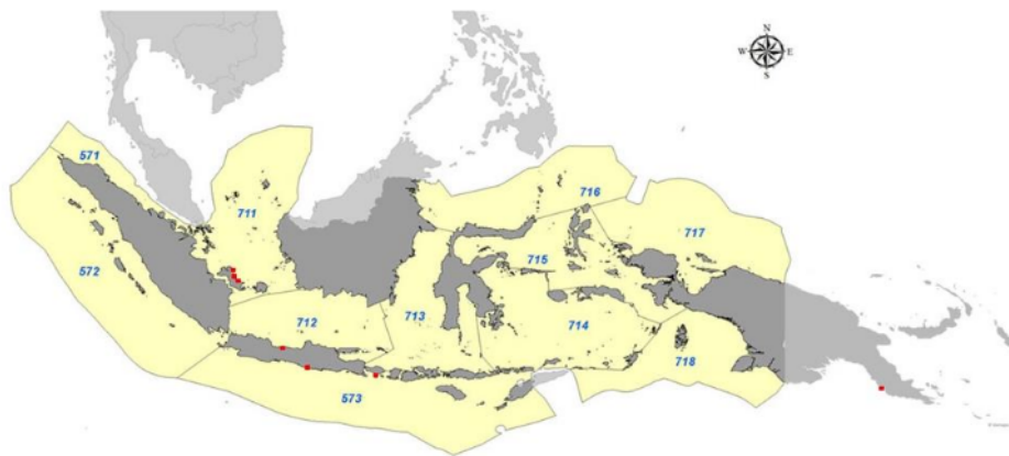
Gambar 1. Lokasi asal sekuen Rhina ancylostoma dari Bangka, Pangkalpinang, Bangka Tengah (Kepulauan Bangka Belitung), Tegal (Jawa Tengah), Pacitan (Jawa Timur), Jimbaran (Bali), dan Papua New Guinea.

Biotechnology Information (NCBI) dan Barcode of Life Data System (BOLD). Terdapat sembilan sekuen Rhina ancylostoma gen COI yang diperoleh dari sumber-sumber tersebut yang berasal dari Pulau Bangka, Jawa, dan Bali (Gambar 1). Nukleotida spesies yang sama dari India dan Papua New Guinea digunakan sebagai pembanding dan outgrup (Tabel 1).