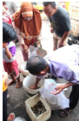
Gambar 2. Ikan cempedik yang diperdagangkan di Pasar Gantung, Belitung Timur.