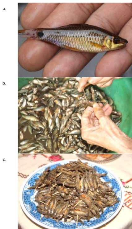
Gambar 3. Proses pengolahan ikan cempedik. a. Ikan cempedik, b. Proses pengeluaran isi perut ikan, c. Produk ikan cempedik goreng.

Pengolahan ikan cempedik dilakukan secara tradisional sebagai sumber protein makanan keluarga. Pengolahan ikan cempedik yang paling umum adalah melalui proses penggorengan. Hal yang membedakan dengan pengolahan ikan lainnya adalah pada pengeluaran isi perut ikan cempedik meskipun ikan berukuran kecil. Ikan cempedik memunculkan rasa lebih pahit jika isi perut tidak dikeluarkan sebelum proses pengolahan. Pengeluaran isi perut menggunakan lidi yang ditarik melalui lubang anus ikan (Gambar 3).