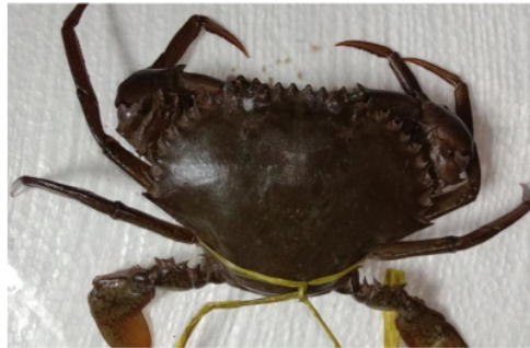
Gambar 2. Scylla tranquebarica

Perbedaan jumlah hasil tangkapan kepiting bakau Scylla tranquebarica disebabkan jenis kepiting ini lebih menyukai habitat yang memiliki bahan makanan yang cukup untuk kehidupannya dan pada setiap stasiun memiliki karakteristik habitat yang berbeda sehingga sumber makanan kepiting bakau juga berbeda pada stasiun penelitian. Jenis kepiting bakau yang paling sering dijumpai di kawasan mangrove Indonesia adalah Scylla serata , hal ini sangat berbeda dengan hasil penelitian sebelumnya yang pernah dilakukan. Hal ini dikarenakan banyaknya penangkapan kepiting bakau yang dilakukan oleh nelayan setempat sehingga terjadinya penurunan populasi Scylla serata di kawasan mangrove Sungai Manggar Kabupaten Belitung Timur ini. Meskipun jenis kepiting bakau Scylla serata memiliki toleransi penyebaran yang luas. Hal ini sesuai dengan Triyanto et al (2013) penangkapan kepiting secara berlebihan oleh nelayan menyebabkan penurunan populasi Scylla serata di alam, selain itu disebabkan rusak/hilangnya habitat alami ekosistem mangrove sehingga kepiting bakau kehilangan kesempatan untuk tumbuh dan berkembang dengan baik.