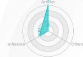
Scopus GScholar WOS