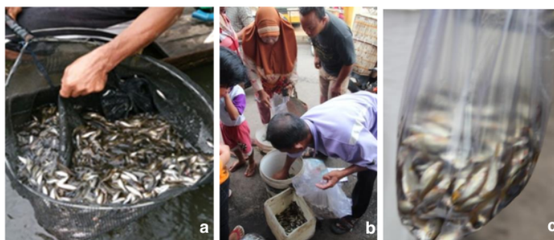
Gambar 4. Proses Perdagangan Ikan Cempedik

waring menyebabkan semua ukuran Ikan Cempedik tertangkap tanpa terseleksi. Ikan Cempedik yang diperoleh dari tangkapan di Sungai Lenggang memiliki panjang total rata-rata 49,42 mm dengan panjang maksimum teridentifikasi 53,6 mm. Ikan dengan spesies yang sama tertangkap di Sungai Lelabi, Pulau Bangka memiliki panjang total rata-rata 49,27 mm dengan panjang maksimum ikan mencapai 73,4 mm. Osteochilus spilurus di Pulau Bangka yang tidak ditangkap dan diperdagangkan secara komersil dimungkinkan mempengaruhi perbedaan panjang maksimum ikan yang tertangkap. Pendapat tersebut seiring dengan Allan et al. (2005), yang menyatakan bahwa karakteristik dampak eksploitasi tangkapan ikan adalah bobot tangkapan menurun, rata-rata panjang maksimum ikan berkurang. Proses perdagangan Ikan Cempedik pada Gambar 4.