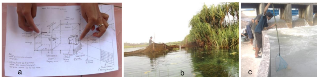
Gambar 3. Alat Tangkap Ikan Cempedik di Belitong Timur

Lebih dari 75% responden di Manggar dan seluruh responden di Gantung menyatakan bahwa Ikan Cempedik memasuki musim penangkapan saat musim penghujan. Pengetahuan lebih mendalam tentang jenis alat tangkap yang digunakan dalam penangkapan Ikan Cempedik terdapat pada 65 – 70% responden di kedua wilayah wawancara, dimana responnya sesuai dengan paparan informan kunci. Nelayan di Sungai Lenggang menangkap Ikan Cempedik menggunakan Sero (Gambar 3a). Sero merupakan alat tangkap ikan secara pasif, dimana ikan dijebak masuk kedalam Sero. Kurniawan et al. (2016), menjelaskan bahwa Sero yang digunakan untuk menangkap Ikan Cempedik berbahan waring dengan dua ruang pengumpulan ikan dan lengan di sisi kiri kanan mulut Sero untuk mengarahkan ikan menuju mulut Sero. Fakhurrozi et al. (2016), menjelaskan alat tangkap Sero yang dipasang pada badan sungai mencapai hasil optimal saat musim penghujan karena terdapat pergerakan ikan dalam jumlah besar akibat arus air. Selain alat tangkap pasif, Ikan Cempedik juga ditangkap secara aktif menggunakan tanggok (Gambar 3b) di Bendungan Pice pada Ikan Cempedik yang terbawa arus ke muara sungai (Kurniawan et al. , 2016).