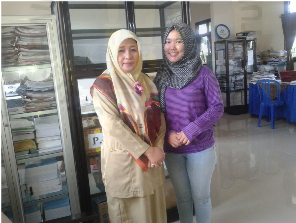
Gambar 4 Wawancara Bersama Guru Agama Islam SMA Negeri 1 Sungailiat