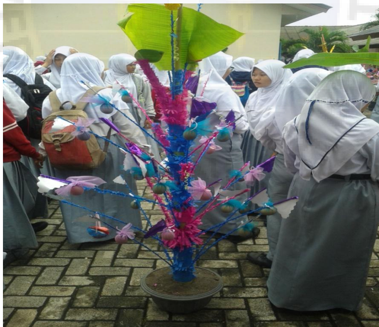
Gambar 10 Acara Khataman dengan Telur Hias di SMA Negeri 1 Sungailiat