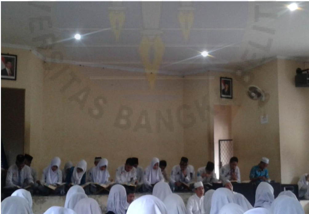
Gambar 8 Acara Khataman Al Qur'an di SMA Negeri 1 Sungailiat