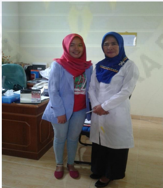
Gambar 2 Wawancara Bersama Sekertaris Dinas Pendidikan Kabupaten Bangka