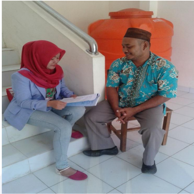
Gambar 5 Wawancara Bersama Guru Agama Islam SMA Negeri 1 Sungailiat