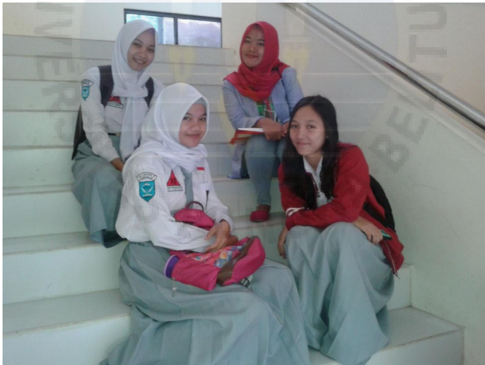
Gambar 6 Wawancara Bersama Siswa SMA Negeri 1 Sungailiat