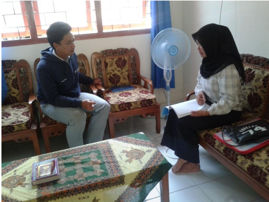
Gambar 7 Wawancara Bersama Siswa SMA Negeri 1 Sungailiat