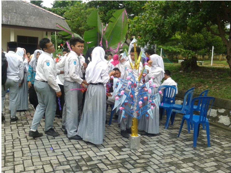
Gambar 9 Acara Khataman dengan Telur Hias di SMA Negeri 1 Sungailiat