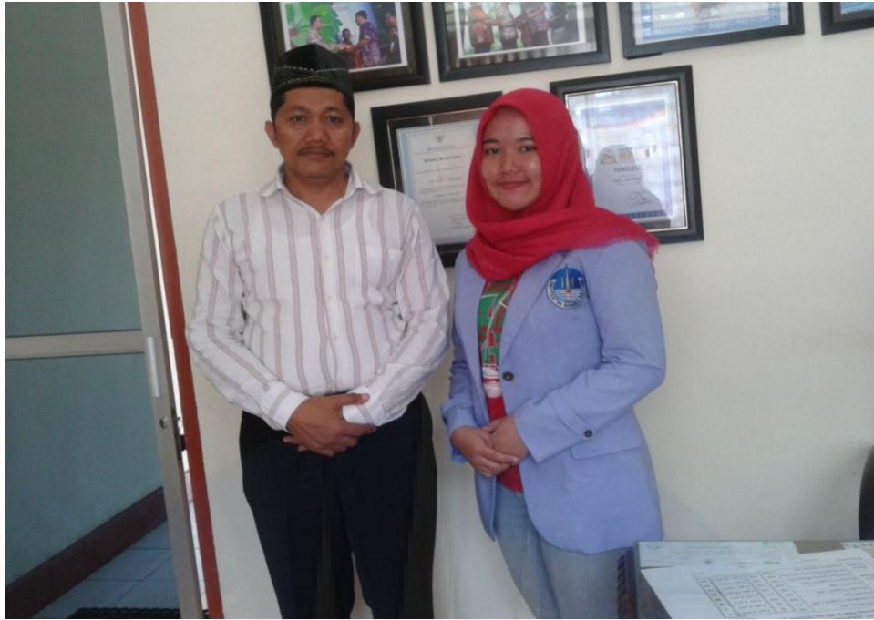
Gambar 3 Wawancara Bersama Kepala SMA Negeri 1 Sungailiat