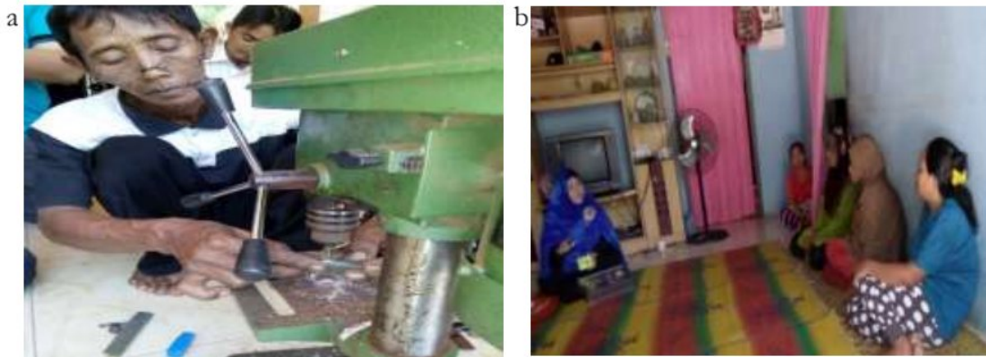
Gambar 5.a. pembuatan tasbih, b. pelatihan analisis keuntungan dan pembukuan sederhana