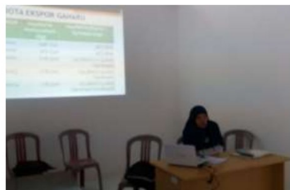
Gambar 2. Sosialisasi konservasi gaharu: Poktan Air Pasir Maju (kiri), Gapoktan Alam Jaya Lestari (kanan)