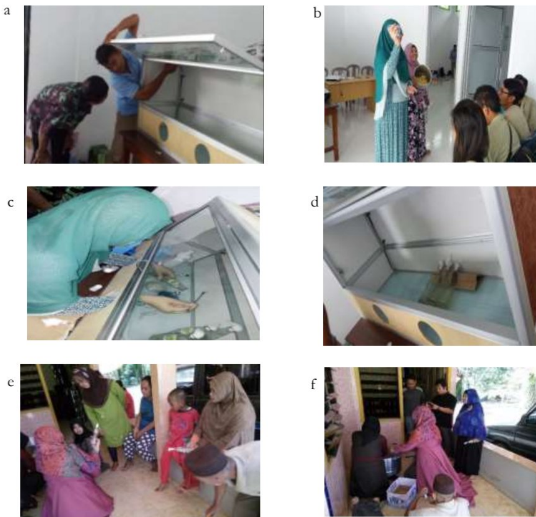
Gambar.3. Pelatihan pembuatan inokulan (a) penjelasan bagian-bagian enkas dan fungsinya, (b) penjelasan pembuatan media, (c) penjelasan teknik transfer cendawan dan perbanyak inokulan, (d) pembuatan media agar miring, (e) penjelasan ciri media yang tidak terkontaminasi, (f) killing media yang terkontaminasi.