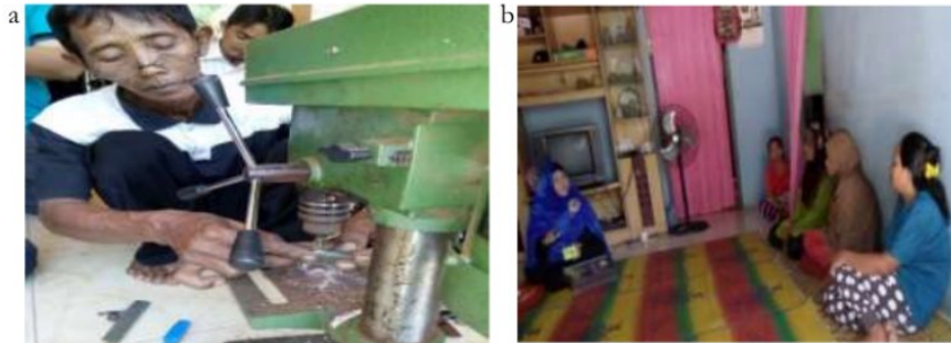
Gambar 5.a. pembuatan tasbeih, b. pelatihan analisis keuntungan dan pembukuan sederhana