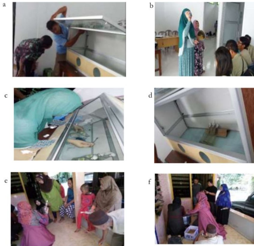
Gambar.3. Pelatihan pembuatan inokulan (a) penjelasan bagian-bagian enkas dan fungsinya, (b) penjelasan pembuatan media, (c) penjelasan teknik transfer cendawan dan perbanyak inokulan, (d) pembuatan media agar miring, (e) penjelasan ciri media yang tidak terkontaminasi, (f) killing media yang terkontaminasi.