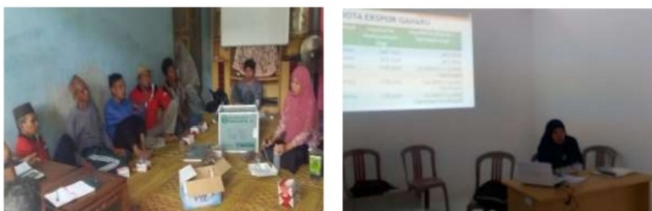
Gambar 2. Sosialisasi konservasi gaharu: Poktan Air Pasir Maju (kiri), Gapoktan Alam Jaya Lestari (kanan)

Permasalahan yang paling banyak ditanyakan oleh masyarakat yang hadir yaitu kepastian harga dan regulasi yang mengatur perdagangan gaharu. Saran yang diajukan oleh masyarakat adalah adanya asosiasi yang melindungi dan menjaga pasar gaharu budidaya, jika gaharu alami ada asosiasinya ASGARIN, maka perlu dibentuk asosiasi untuk gaharu budidaya. Pihak Dinas Perkebunan dan Kehutanan Bangka Tengah berjanji akan membantu petani mengurus perdagangan dan merekomendasikan pengumpul yang membeli gaharu budidaya dari petani sehingga petani menjual gaharu kepada pengumpul yang akan mengimpor ke luar negeri.