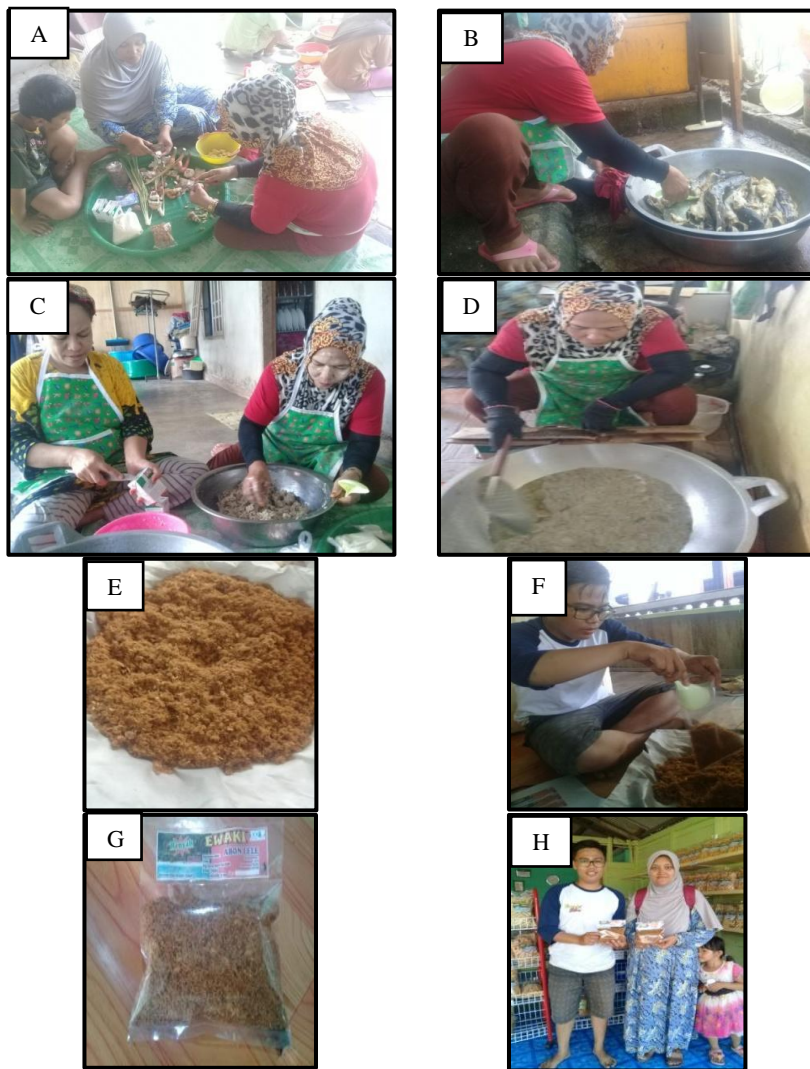
Gambar 5. Aktivitas produksi abon di Desa Kurau Barat (A. persiapan bahan baku; B. Perebusan ikan; C. Pelumatan ikan; D. Penggorengan; E. Abon siap dikemas; F. Pengemasan abon; G. Abon kemasan 100 gram; H. Lokasi pemasaran produk).

lele dan kemplang dari tulang ikan lele. Proses produksi abon di Desa Kurau Barat dimulai dari persiapan bahan baku dan bumbu, perebusan, pelumatan daging, penggorengan, hingga pengemasan produk sebagaimana tersaji pada Gambar 5 .