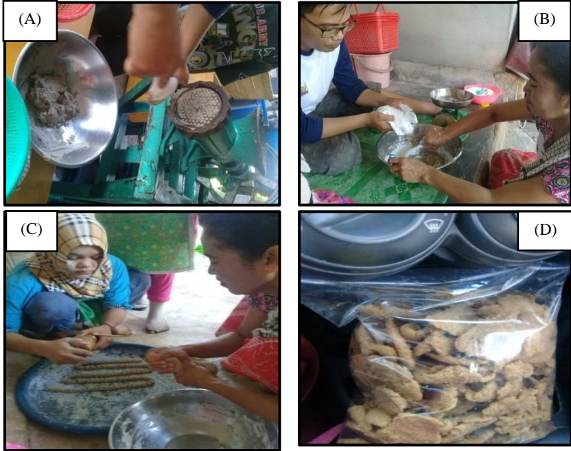
Gambar 6. (A) Penggilingan tulang; (B) Penimbangan bahan baku; (C) Pencetakan; dan (D) Kemplang siap dipasarkan.

Limbah sisa produksi abon yang berupa tulang ikan, selanjutnya dimanfaatkan dan diolah menjadi kemplang tulang. Proses pembuatan kemplang ikan seperti penggilingan tulang, penimbangan bahan baku, pencetakan dan pengemasan tersaji pada Gambar 6 .