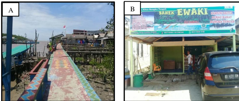
Gambar 4. (A) Suasana Desa Kurau Barat; (B) Lokasi pelaksanaan IBM.

Desa Kurau Barat merupakan desa yang mayoritas penduduknya berprofesi sebagai nelayan. Hal tersebut didukung oleh kondisi geografis desa yang terletak di wilayah pesisir. Di sepanjang jalan desa berjajar rumah rumah produksi dan pemasaran hasil olahan ikan laut seperti getas, kemplang, dan kerupuk ikan. Suasana desa dan lokasi IBM di Desa Kurau Barat tersaji pada Gambar 4 .