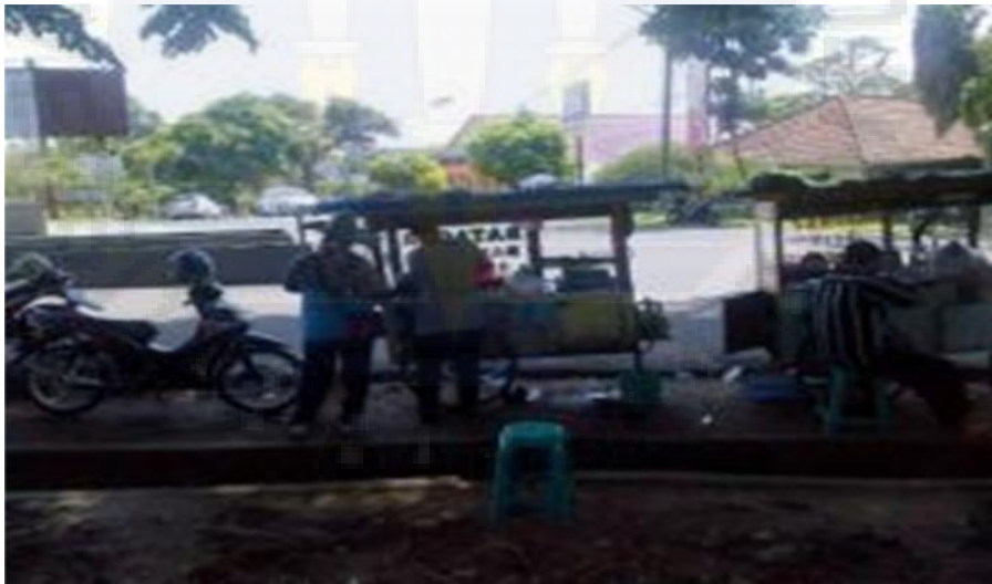
2. Pedagang di kawasan Taman Lokomotif.