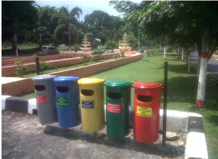
3. Penyediaan tempat sampah di kawasan Taman Lokomotif.