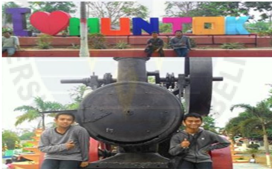
4. Wawancara bersama pengunjung asal Solo Joy di Taman Lokomotif (23).