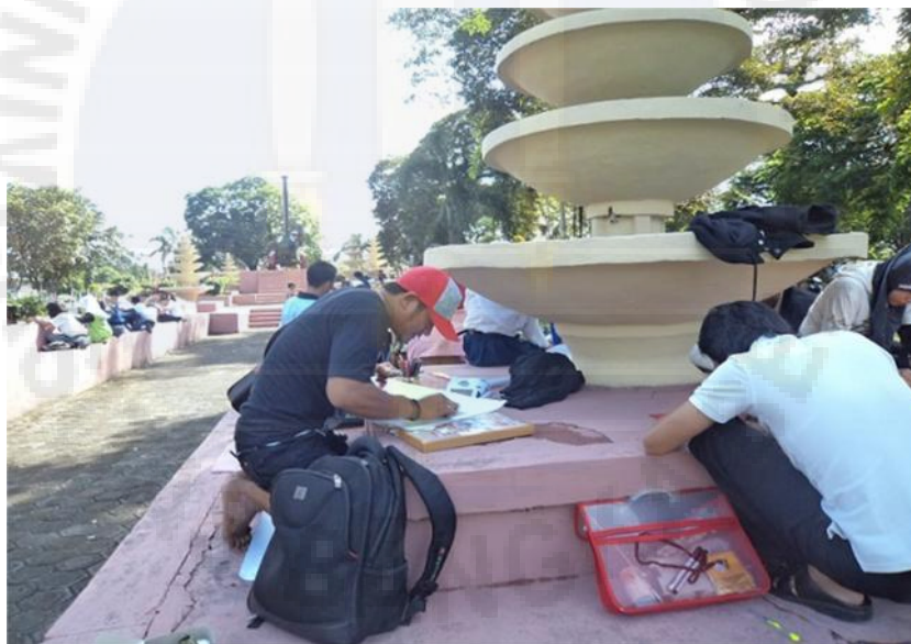
Gambar 6. Kegiatan Lomba Melukis di Taman Lokomotif