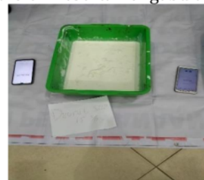
Gambar 3c. Perlakuan 3