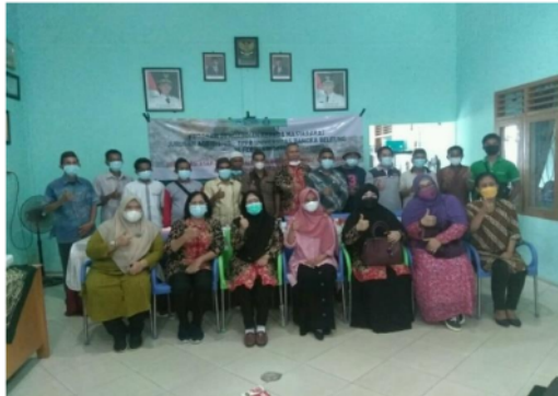
Gambar 4. Tim Agribisnis Bersama Petani Karet Sebagai Peserta Penyuluhan dan Pelatihan