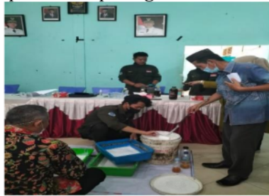
Gambar 2. Praktik Penggumpalan Getah Karet yang Diikuti oleh Peserta Pengabdian

Peserta antusias mengikuti pelatihan penggumpalan getah karet menggunakan asap cair. Hal ini terlihat dari adanya peserta yang ikut serta dalam demonstrasi atau praktek menggumpalkan getah karet menggunakan asap cair (Gambar 2). Dokumentasi pada kegiatan pelatihan tersebut dapat dilihat pada gambar berikut.