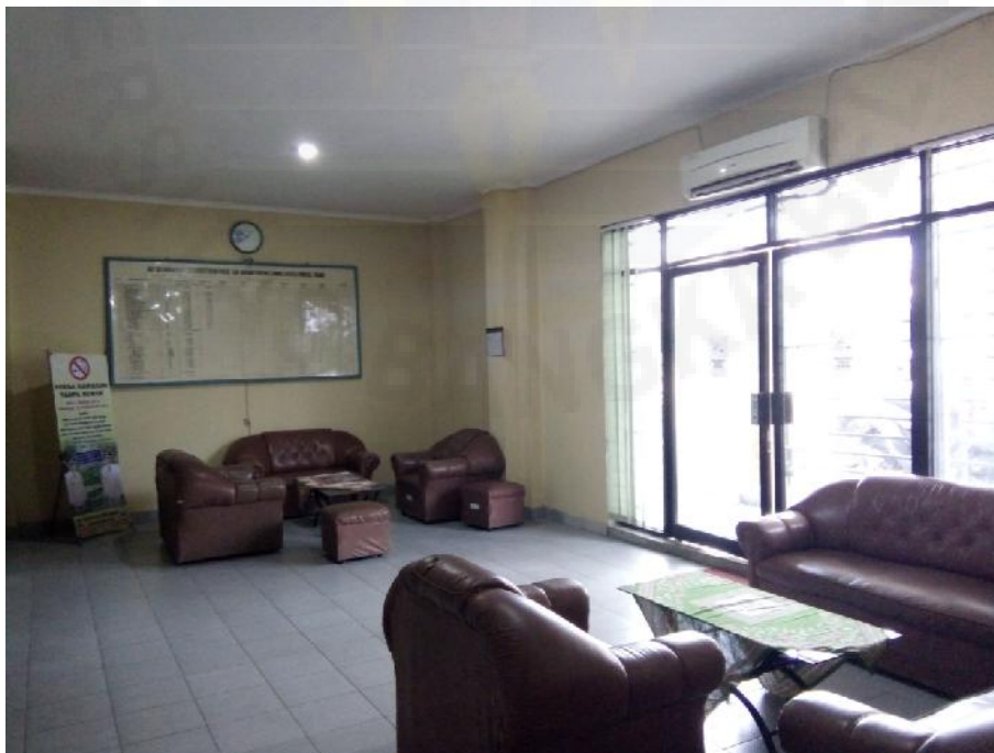
Foto Lobby Disperindagkop dan UMKM Kota Pangkalpinang