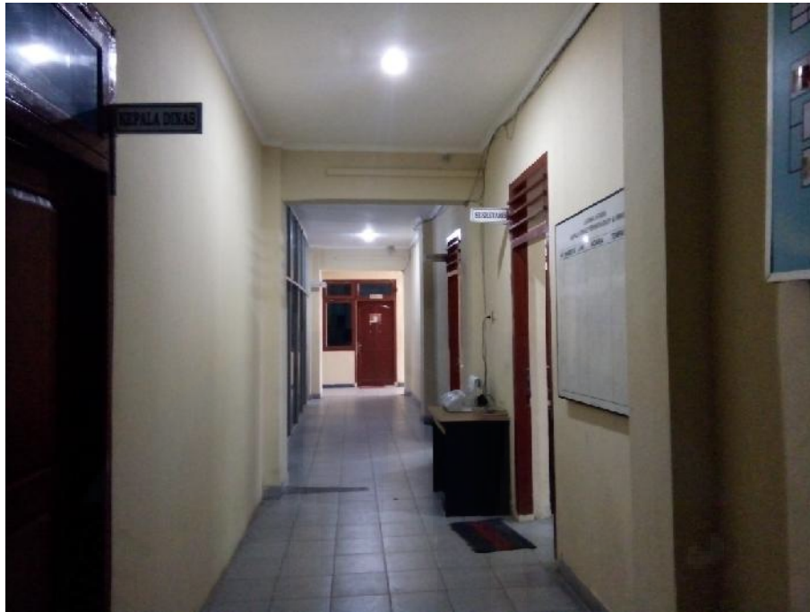
Foto Lorong Ruang Kepala Dinas, Sekretaris Dan Tata Usaha Disperindagkop dan UMKM Kota Pangkalpinang