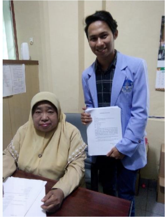
Foto Bersama Pegawai Tata Usaha Disperindagkop dan UMKM Kota Pangkalpinang