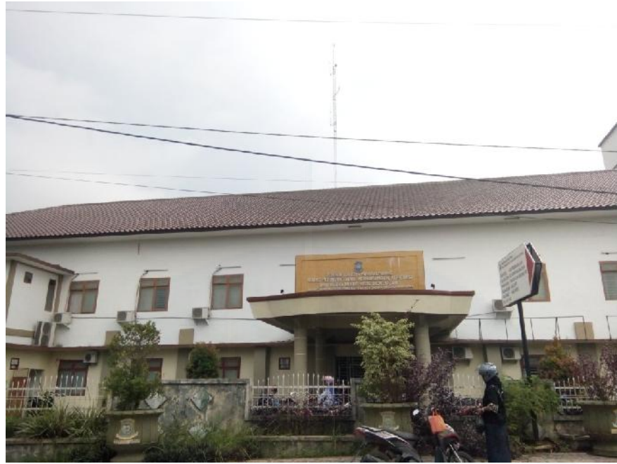
Halaman Depan Disperindagkop dan UMKM Kota Pangkalpinang