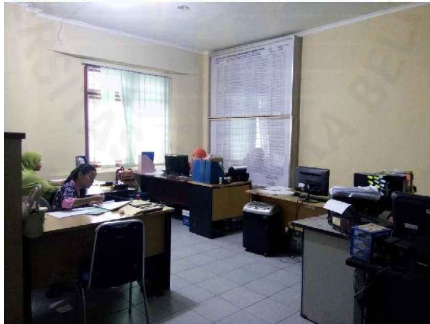
Ruang Kerja Tata Usaha Disperindagkop dan UMKM Kota Pangkalpinang