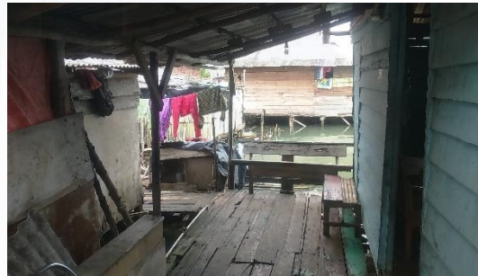
Gambar 8a dan b. Kondisi Rumah Responden Nelayan