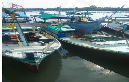
Gambar 9a dan b. Kapal Milik Responden Nelayan