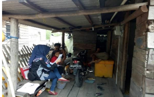
Gambar 7a dan b. Wawancara