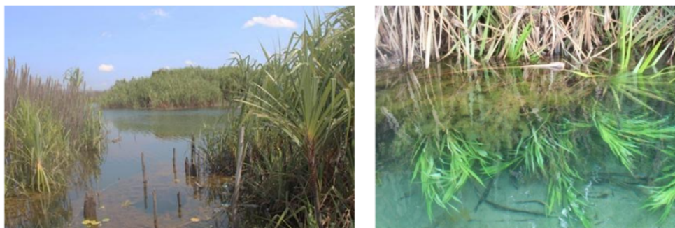
Gambar 4. Ikan Cempedik sering ditemui didekat tanaman air yang tumbuh di Sungai Lenggang

Penempatan sero yang menghasilkan tangkapan Ikan Cempedik dalam jumlah besar menunjukkan nelayan memahami lokasi-lokasi yang dilewati migrasi Ikan Cempedik, sebagaimana pada Gambar 6 , di mana nelayan menempatkan sero pada bagian tengah sungai di dekat rasau yang berada di sekitar bagian dalam Sungai Lenggang. Lokasi tersebut diyakini menghasilkan tangkapan Ikan Cempedik yang cukup besar pada musim penghujan dan terbukti pada awal musim penghujan bulan desember 2015 diperoleh Ikan Cempedik sekitar 2 jurigen dengan kurang lebih 20 kilogram Ikan Cempedik setiap jurigen.