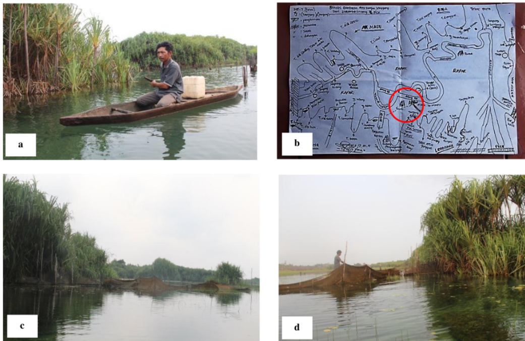
Gambar 6. Masyarakat memilih lokasi penempatan sero untuk penangkapan Ikan Cempedik (a) Nelayan Ikan Cempedik dengan jukung kayu menuju lokasi sero, (b) Peta Sungai Lenggang dan area yang ditandai lingkaran merah merupakan lokasi penempatan sero, (c) Penempatan sero di dekat tumbuhan air dan (d) Nelayan membersihkan sero di luar musim panen Cempedik.