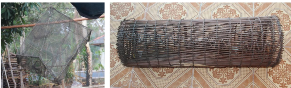
Gambar 2. Bubu berbahan waring (kiri) dan bambu/rotan (kanan)

Selain itu, diperoleh juga informasi alat tangkap yang biasa digunakan oleh masyarakat untuk menangkap Ikan Cempedik berupa sero atau bubu ( Gambar 3 ) serta daerah tinggal Ikan Cempedik yang cenderung berlingung di sekitar tanaman air, seperti kumpai air, rasau ( Pandanus sp), ataupun rerumputan dan tumbuhan lainnya yang mati di dasar perairan ( Gambar 4 ).