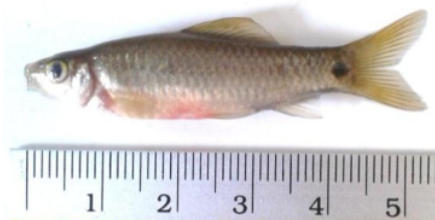
Gambar 7. Ikan Cempedik dari Perairan Gantung, Belitung Timur