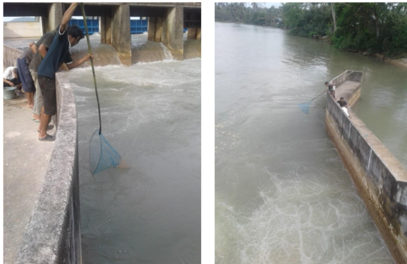
Gambar 5. Aktivitas penangkapan ikan Cempedik di Bendungan Pice.