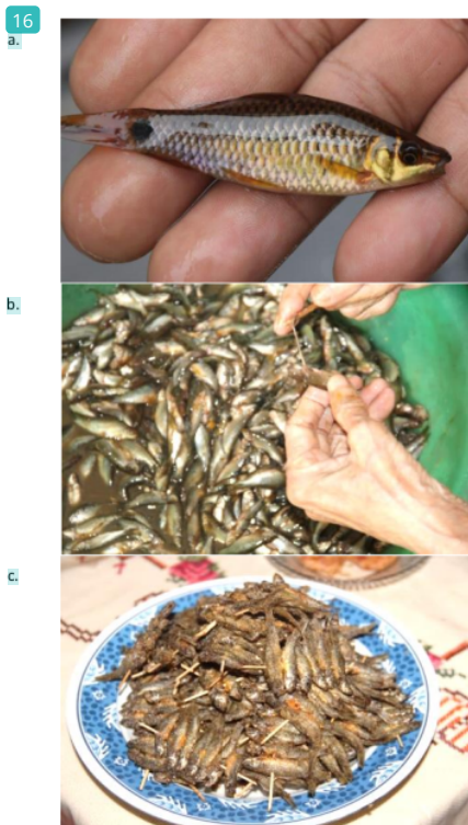
Gambar 3. Proses pengolah ikan cempedik. a. Ikan cempedik, b. Proses pengeluaran isi perut ikan, c. Produk ikan cempedik goreng.

Pengolahan ikan cempedik dilakukan secara tradisional sebagai sumber protein makanan keluarga. Pengolahan ikan cempedik yang paling umum adalah melalui proses penggorengan. Hal yang membedakan dengan pengolahan ikan lainnya adalah pada pengeluaran isi perut ikan cempedik meskipun ikan berukuran kecil. Ikan cempedik memunculkan rasa lebih pahit jika isi perut tidak dikeluarkan sebelum proses pengolahan. Pengeluaran isi perut menggunakan lidi yang ditarik melalui lubang anus ikan (Gambar 3).