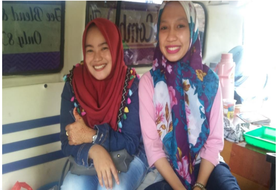
Gambar 5. Penjual foodtruck minuman