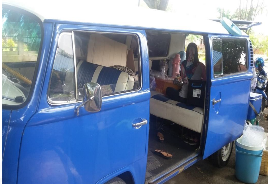
Gambar 3. Foodtrcuk minuman es wisco