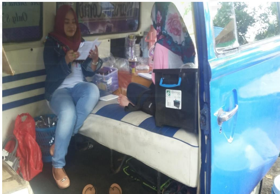
Gambar 4. Wawancara kepada penjual minuman wisco