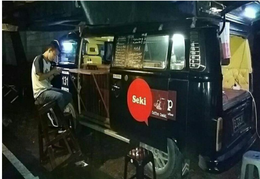
Gambar 7. Penjual foodtruck makanan ringan