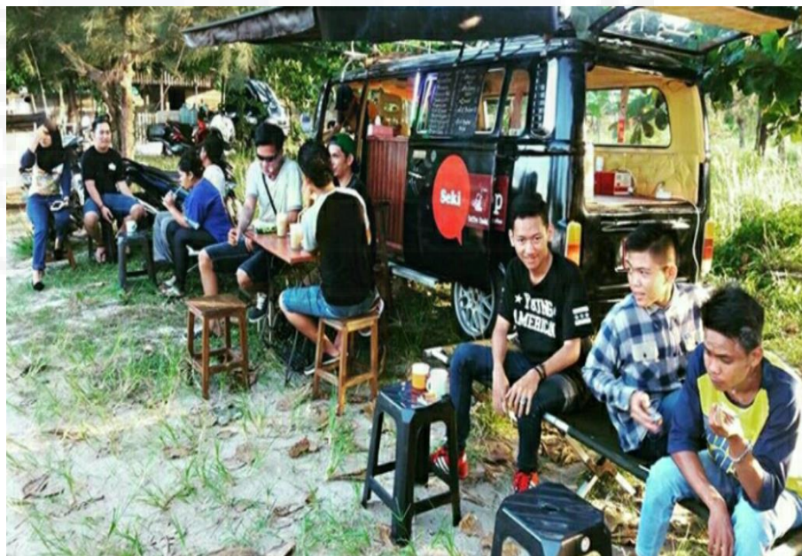
Gambar 10. Pengunjung setia foodtruck makanan ringan