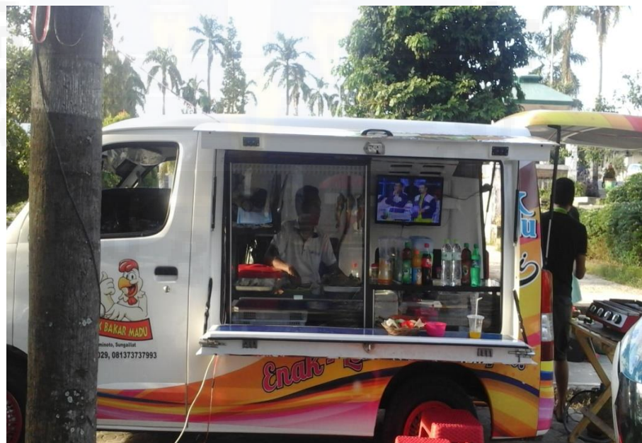
Gambar 2. Foodtrcuk ayam bakar madu dan minuman