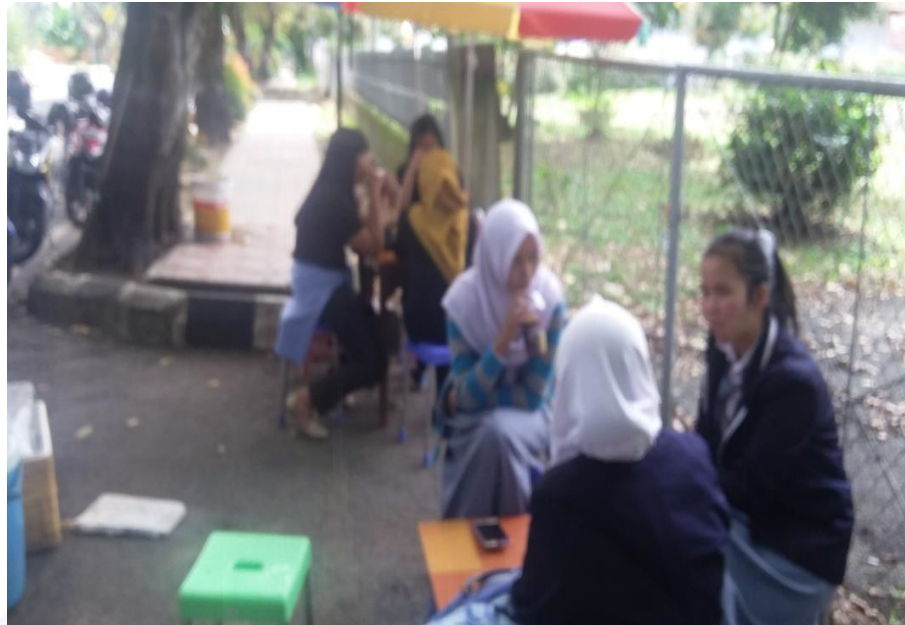
Gambar 9. Pengunjung Setia