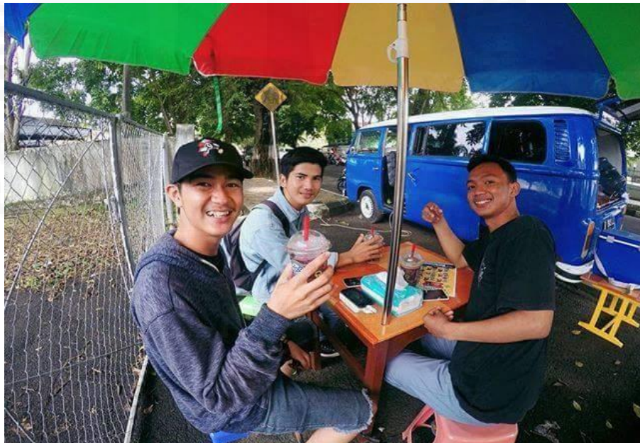
Gambar 8. Pengunjung Setia di foodtruck minuman