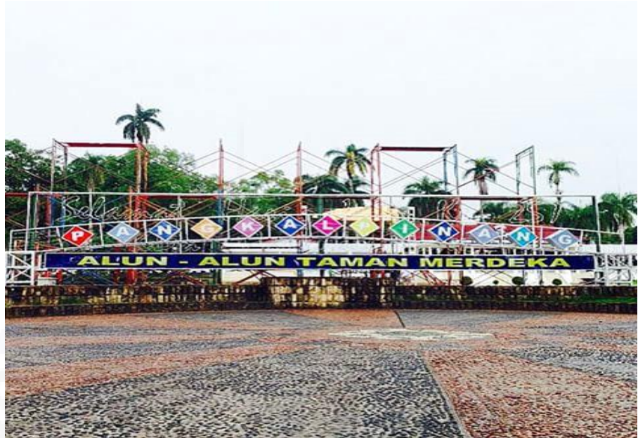
Gambar 1. Alun-alun Kota Pangkalpinang