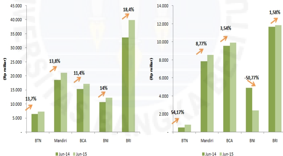
Grafik I.2 Perbandingan Pendapatan Bunga dan Laba Bank pada PT BTN, Bank Mandiri, BCA, BNI, dan BRI tahun 2014-2015

Sumber : http://mbareksa.com (2015/08/04, 13:57:17)