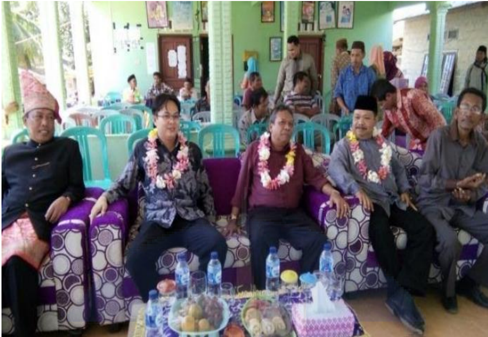
Gambar 3. Foto Gubernur Babel dan Wakil Bupati Bangka Barat dalam menghadiri peringatan acara Sedekah Kampung