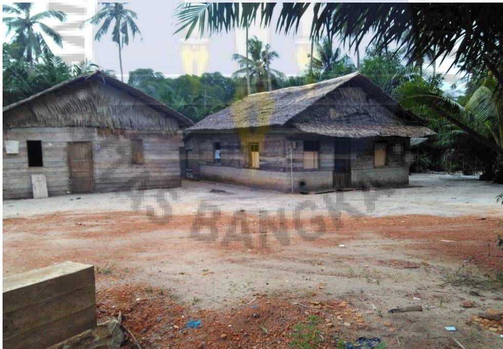
Gambar 12. Suasana perkampungan masyarakat