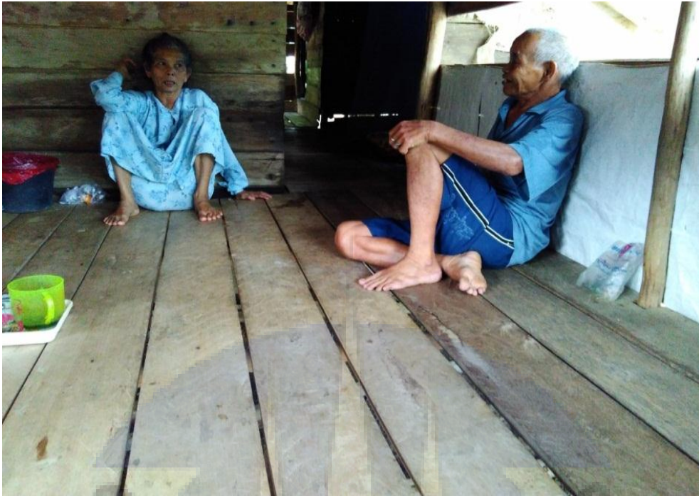
Gambar 9. Wawancara dengan salah satu dukun kampung di Desa Air Menduyung