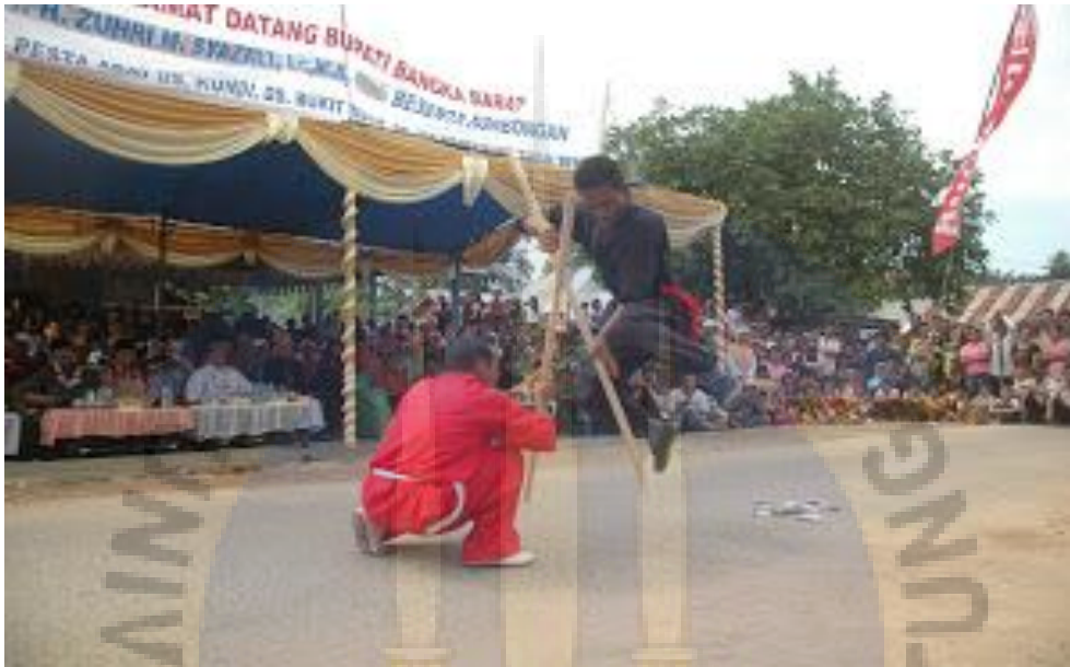
Gambar 1. Suasana pada saat peringatan Sedekah Kampung 'Kundi Bersatu'