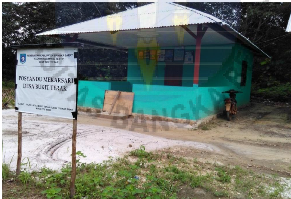
Gambar 14. Salah satu bentuk hasil pembangunan yang dilakukan pasca pemekaran desa