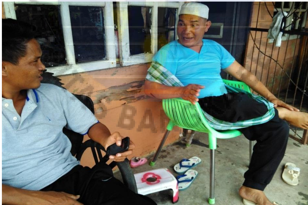
Gambar 8. Wawancara dengan salah satu tokoh masyarakat di Desa Air Menduyung