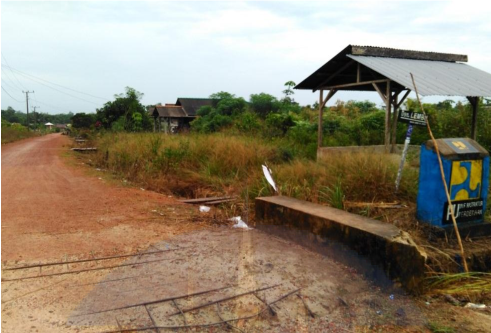
Gambar 11. Kondisi salah satu jalan menuju perkampungan masyarakat di Desa Air Menduyung