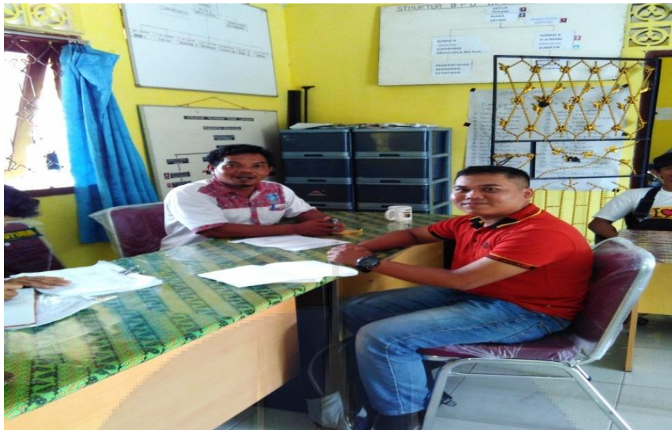
Gambar 15. Wawancara dengan Kepala Desa Kundi dan aparatur desa