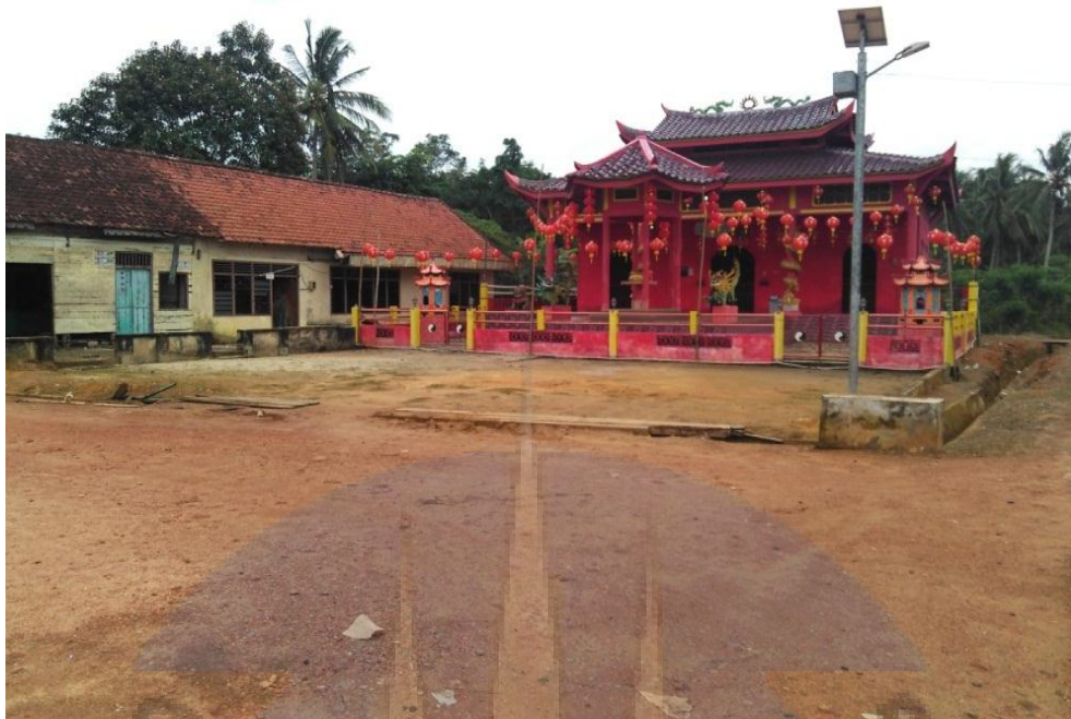
Gambar 13. Rumah ibadah masyarakat tionghoa yang terdapat di Desa Air Menduyung