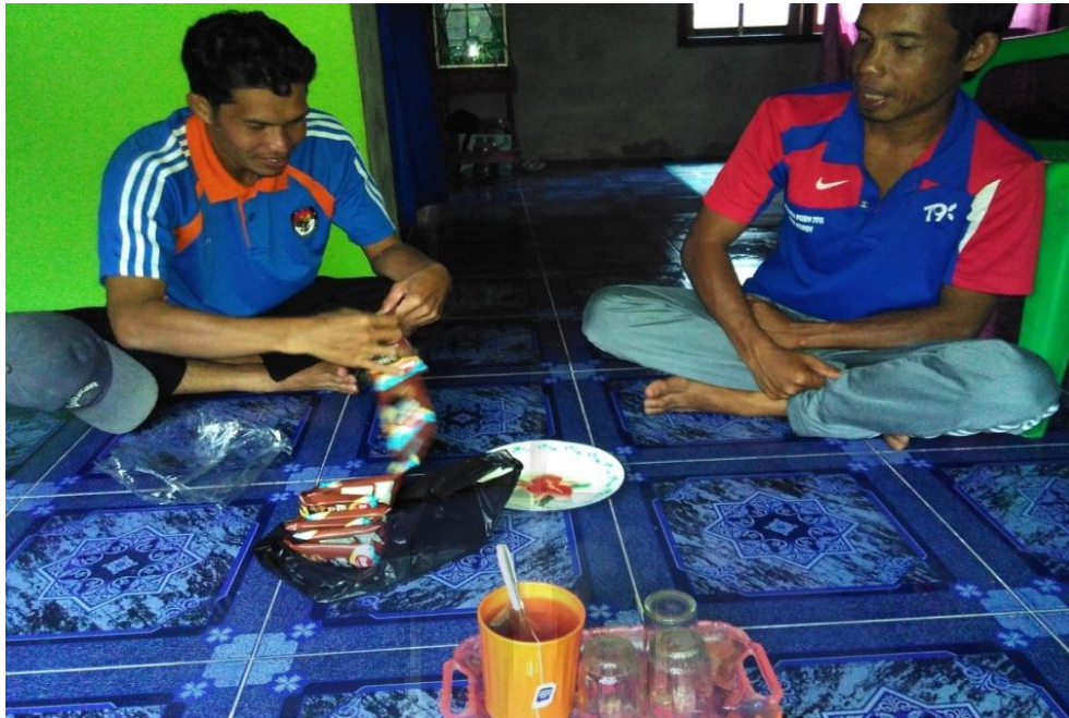
Gambar 5. Wawancara dengan salah satu masyarakat Desa Kundi