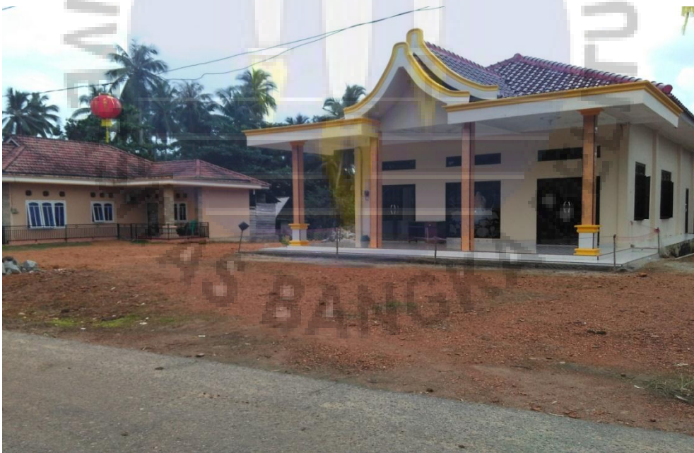
Gambar 4. Rumah Ibadah umat Buddha yang terletak di Desa Air Menduyung