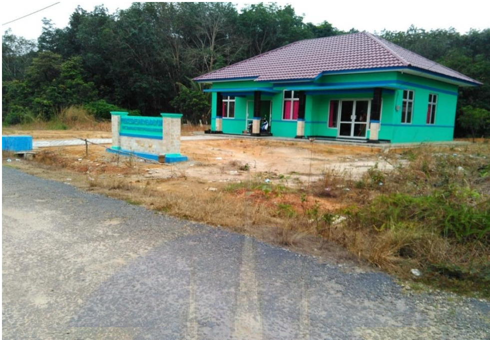
Gambar 7. Infrastruktur Poskesdes sebagai salah satu hasil dari pelaksanaan pembangunan setelah pemekaran.