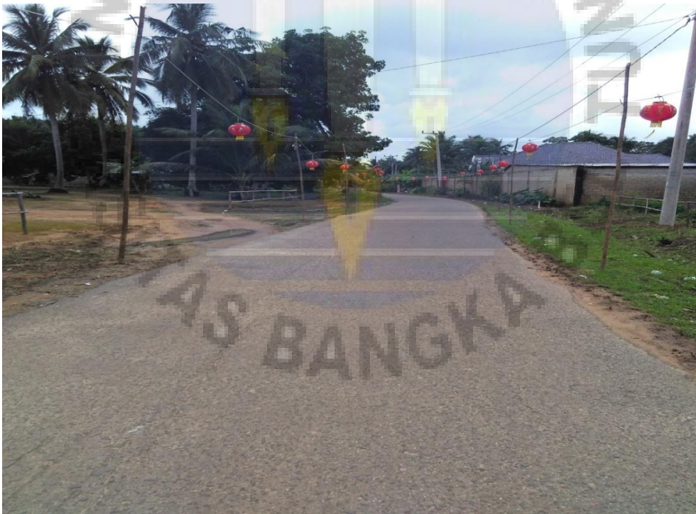
Gambar 6. Suasana perkampungan masyarakat etnis Tionghoa di Desa Air Menduyung