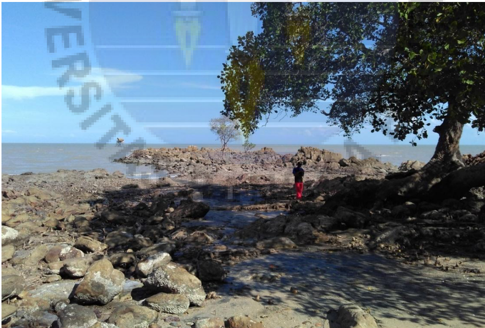
Gambar 10. Tempat/lokasi pelaksanaan Ritual Adat Ceriak