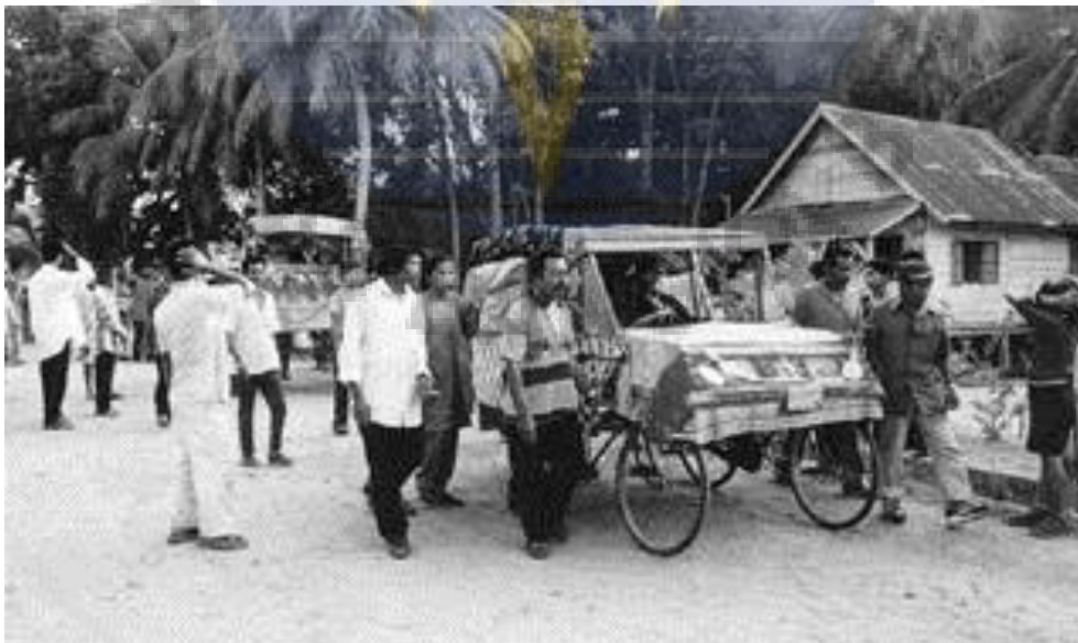
Gambar 2. Suasana pada saat peringatan Sedekah Kampung tempo dulu