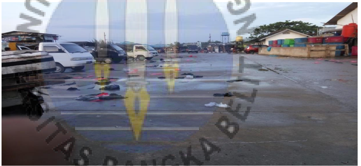
Gambar 4. Kondisi lingkungan TPI Muara Sungai Baturusa