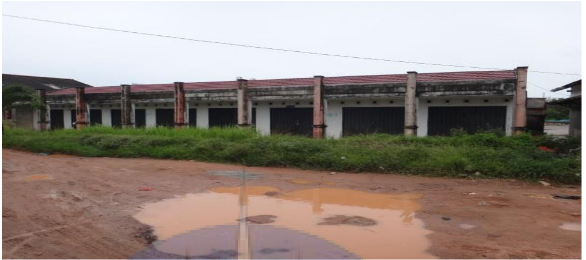
Gambar 3. Kondisi jalan ke TPI Muara Sungai Baturusa