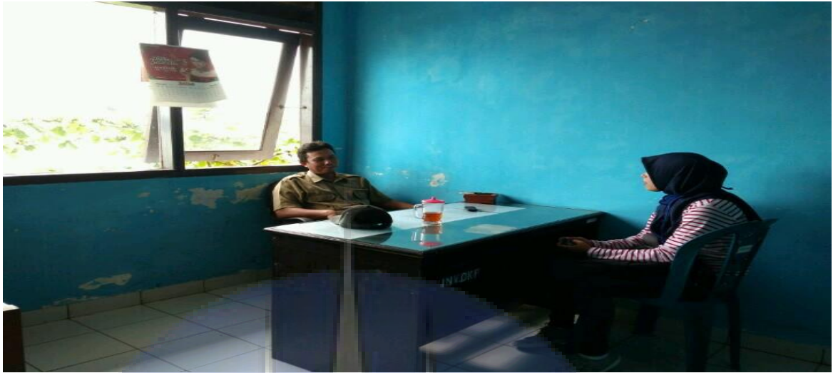
Gambar 1. Wawancara dengan anggota UPT TPI/PPI Muara Sungai Baturusa