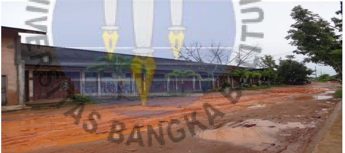
Gambar 2. Ruko dan Kios di TPI Muara Sungai Baturusa