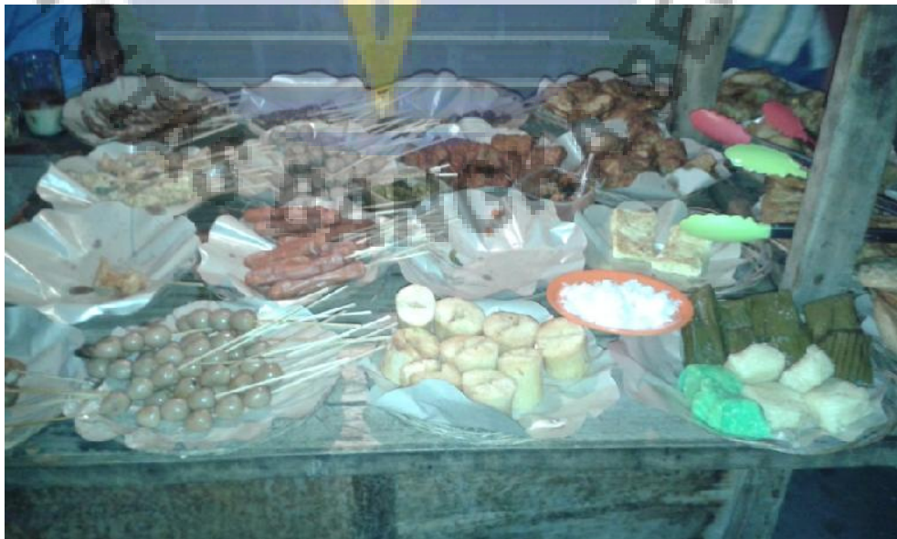
Gambar 2. Makanan di Angkringan Lek Diq