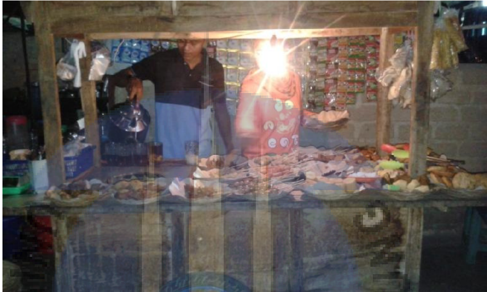
Gambar 1. Gerobak Angkringan lek diq