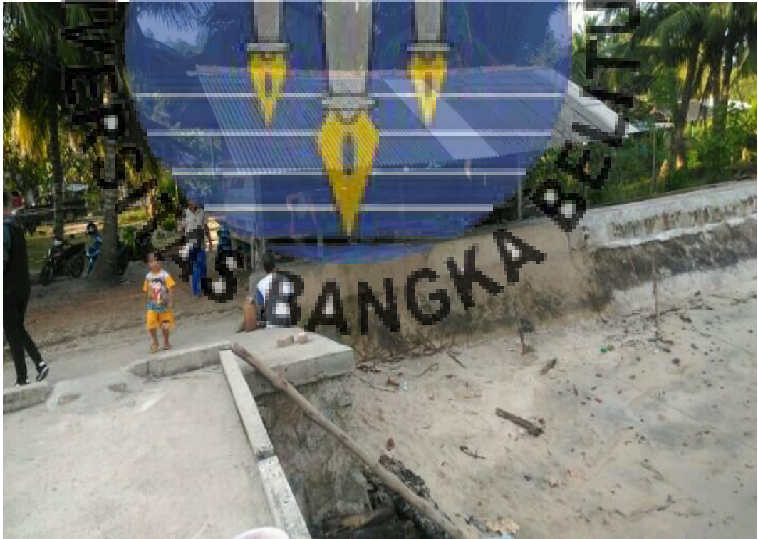
Gambar : Tempat peristirahatan para nelayan