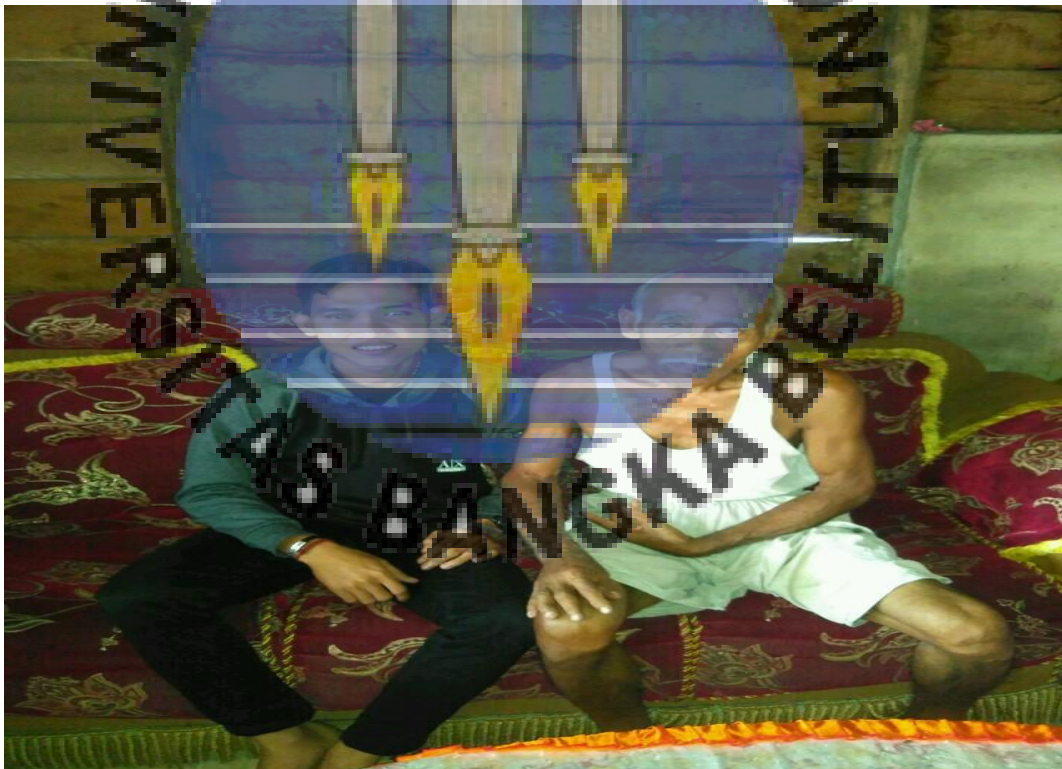
Gambar : Wawancara bersama bapak Sudin