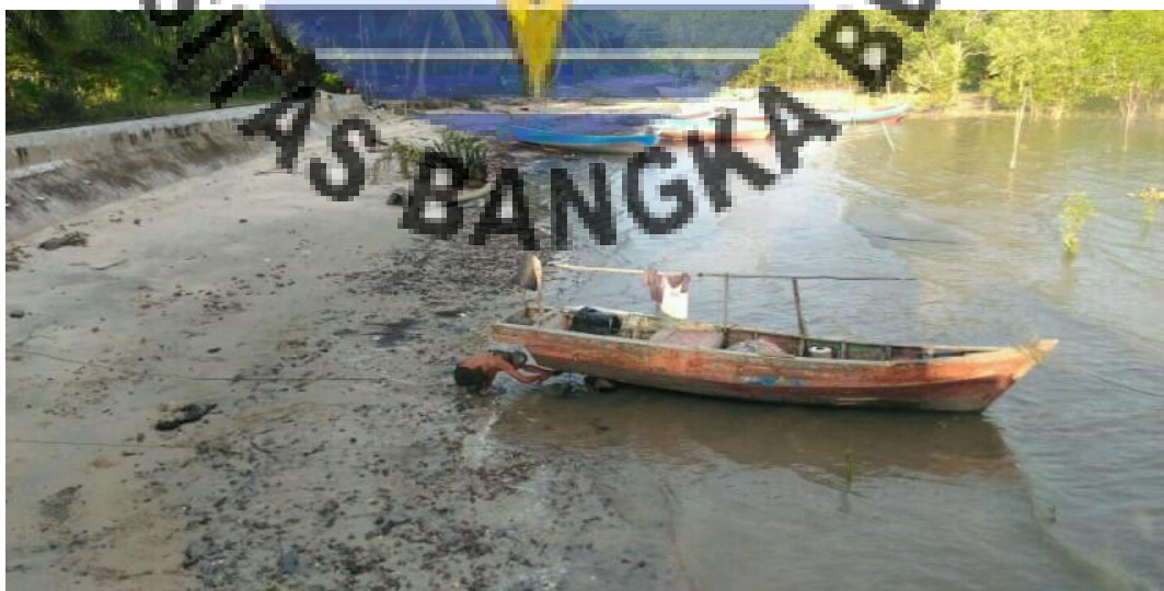
Gambar : Perahu milik nelayan lokal di lokasi dermaga