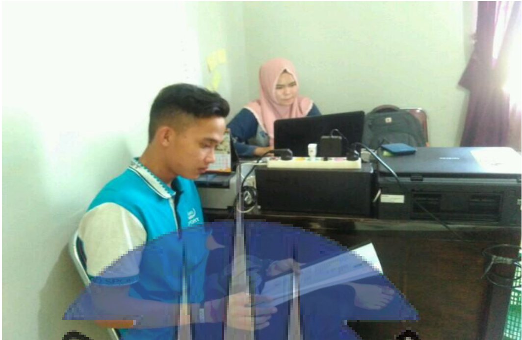
Gambar : Pengambilan data sekunder di Kantor Desa Belo Laut