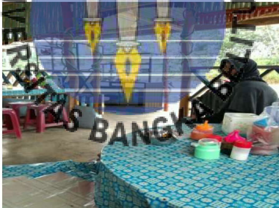
Gambar 6. Wawancara dengan masyarakat Desa Puding Besar