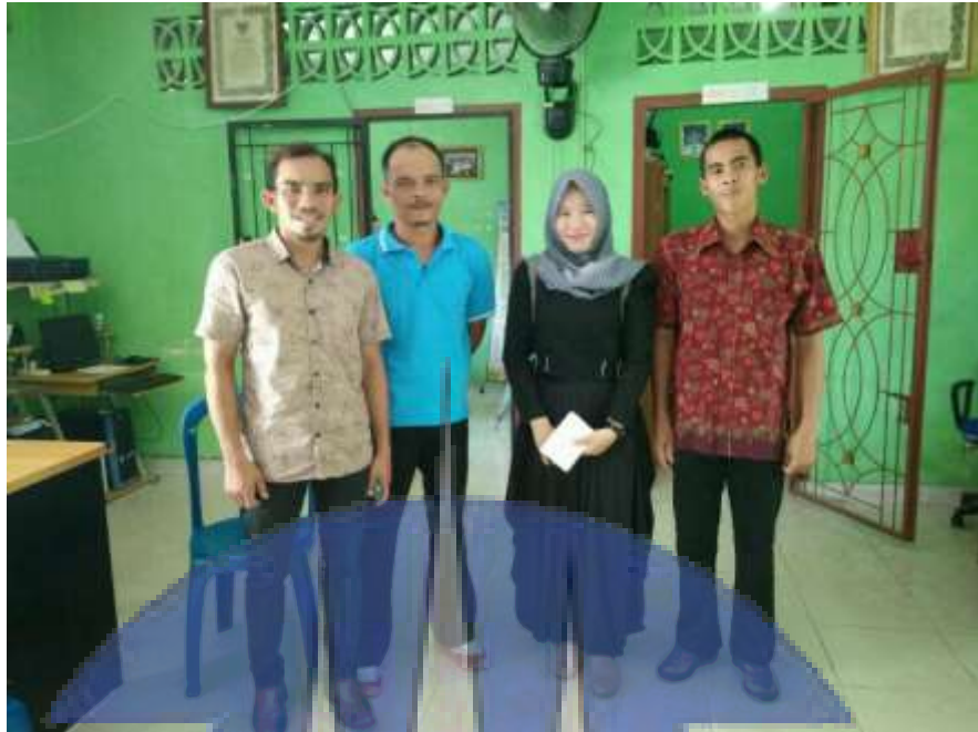
Gambar 5. Wawancara dengan pihak pemerintahan desa Puding Besar