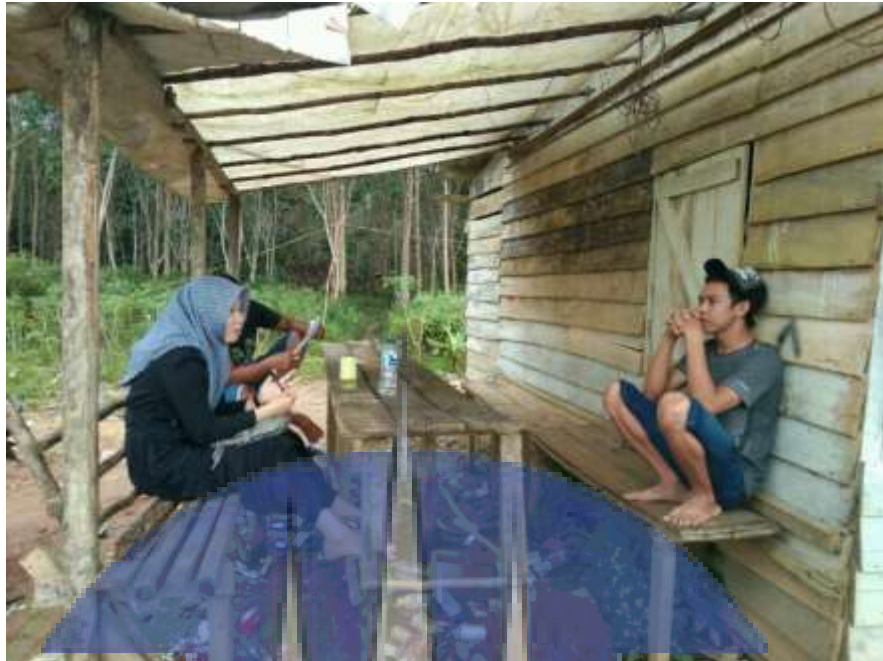
Gambar 3. Wawancara dengan masyarakat Desa Puding Besar