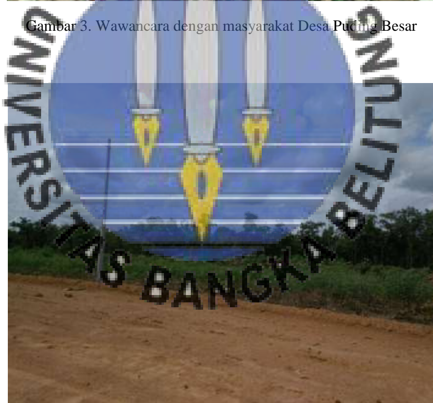
Gambar 4. Tanamaan Ubi Casesa yang sudah ditanam di sepanjang jalan menuju pabrik