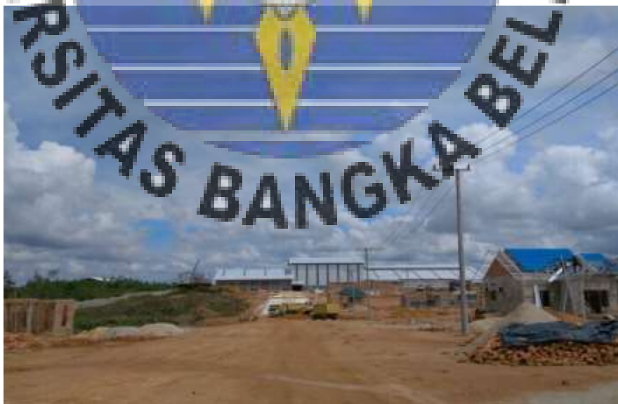
Gambar 2. Tampak Depan Bangunan Pabrik Ubi Casesa masih dalam pembuatan