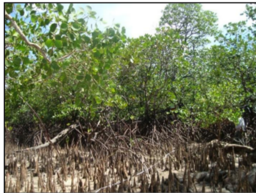
Gambar 6. Kondisi Mangrove Pada Stasiun 5

Stasiun 5 terletak di Kampung Seberang Pulau Batu Dinding, daerah ini merupakan daerah yang terlindung karena letaknya yang tersembunyi dan tepat berada di depan Pesisir Utara Pulau Mendanau. Seperti halnya hutan mangrove di Kampung Tomo' Pulau Mendanau dan di daerah sekitar Tanjung Lumpur Pulau Batu Dinding, vegetasi hutan mangrove di Kampung Seberang kawasan Pesisir Selatan Pulau Batu Dinding terlihat tumbuh subur dan memiliki potensi untuk berkembang. karena di sepanjang garis pantai banyak dijumpai semai ( seedling ) yang tumbuh secara sporadis. Gambaran Kondisi mangrove pada Stasiun 5 disajikan pada Gambar 6 berikut.