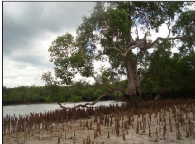
Gambar 7. Kondisi Mangrove Pada Stasiun 6

Stasiun 6 terletak di daerah pangkalan bakau Pulau Batu Dinding, Stasiun ini terletak dihadapan pesisir utara pulau mendanau dengan hamparan pasir di pesisir pantai, daerah ini sering menjadi tempat berlabuhnya perahu-perahu nelayan yang mencari ikan di wilayah sekitar laut Pulau Mendanau dan Pulau Batu Dinding. Gambaran Kondisi mangrove pada Stasiun 5 disajikan pada Gambar 7 berikut ini.