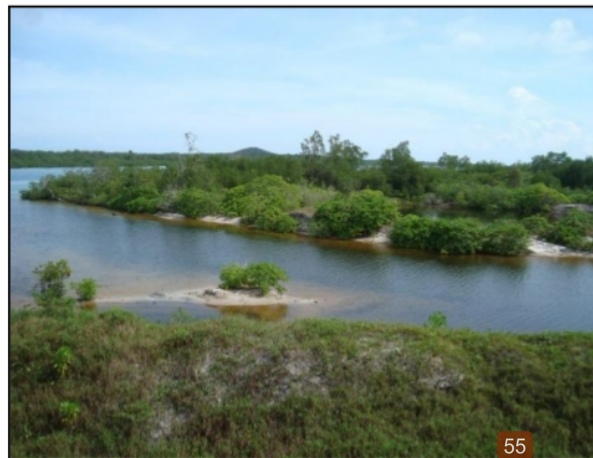
Gambar 3. Kondisi Mangrove Pada Stasiun 2

Lokasi Stasiun 2 terletak di Kampung Pasir tepatnya di wilayah Pesisir Utara Pulau Mendanau dengan kondisi mangrove yang sudah terganggu diduga akibat adanya kegiatan penebangan dan konversi lahan mangrove menjadi tempat pencucian bauksit, sehingga berdampak merubah zonasi mangrove yang ada. Mangrove tumbuh tipis dan tersebar secara tidak merata pada Stasiun 2. Gambaran kondisi mangrove pada Stasiun 2 disajikan pada Gambar 3 berikut ini.