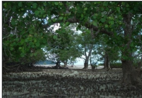
Gambar 2. Kondisi Mangrove Pada Stasiun 1

Stasiun 1 terletak di daerah Pasir Panjang dengan hamparan pasir putih di sepanjang pesisir Utara Pulau Mendanau. Lokasi ini merupakan lokasi yang terbuka karena letaknya yang berdekatan dan berhadapan dengan laut lepas sehingga pengaruh gelombang pada Stasiun 1 relatif lebih besar. Mangrove tumbuh sangat tipis pada Stasiun ini, pada beberapa titik pengamatan terlihat kawasan mangrove yang hilang, hal ini diduga karena wilayah sekitar Stasiun 1 merupakan daerah pasca penanaman pasir kuarsa di laut yang telah berdampak terjadinya sedimentasi. Gambaran kondisi mangrove pada Stasiun 1 disajikan pada Gambar 2 berikut ini.