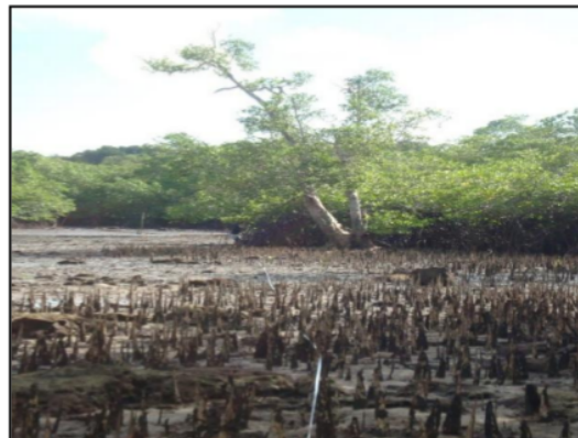
Gambar 5. Kondisi Mangrove Pada Stasiun 4

Stasiun 4 terletak di Tanjung Lumpur Pulau Batu Dinding, Mangrove di sekitar kawasan ini tumbuh lebat dan tersebar secara merata pada beberapa titik pengamatan. Komunitas mangrove di wilayah ini berada di daerah terbuka namun tetap terlindung dari hempasan gelombang besar karena daerah tersebut merupakan daerah terumbu karang yang dapat memecah gelombang di pinggir pantai akan tetapi terumbu karang yang berada dibagian terdepan zonasi mangrove banyak yang mengalami kematian akibat terekspos matahari langsung pada saat air surut.