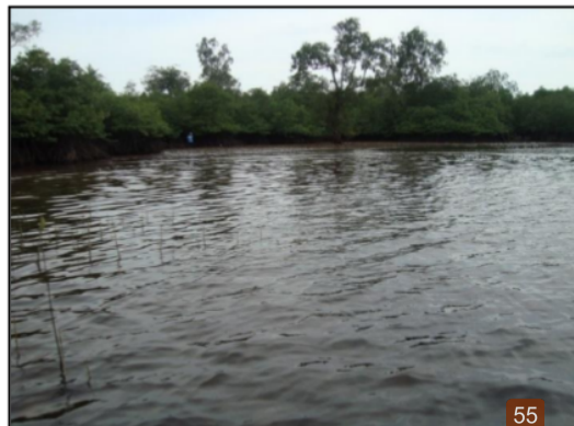
Gambar 4. Kondisi Mangrove Pada Stasiun 3

Stasiun 3 terletak di Kampung Tomo tepatnya tidak jauh berdekatan dengan dermaga kapal pertama yang dibangun di Pesisir Utara Pulau Mendanau. Lokasi mangrove yang berada di sekitar Kampung Tomo terlindung dari hempasan ombak dan dengan kondisi substrat berlumpur yang bercampur dengan pasir, serta dialiri oleh sungai. Peranannya sebagai pelindungnya daerah tersebut cukup penting bagi keberadaan mangrove. Kondisi mangrove pada Stasiun 3 disajikan pada Gambar 4 berikut ini.