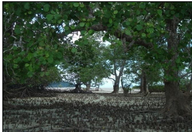
Gambar 2. Kondisi Mangrove Pada Stasiun 1

Stasiun I terletak di daerah Pasir Panjang dengan hamparan pasir putih di sepanjang pesisir Utara Pulau Mendanau. Lokasi ini merupakan lokasi yang terbuka karena letaknya yang berdekatan dan berhadapan dengan laut lepas sehingga pengaruh gelombang pada Stasiun I relatif lebih besar. Mangrove tumbuh sangat tipis pada Stasiun ini, pada beberapa titik pengamatan terlihat kawasan mangrove yang hilang, hal ini diduga karena wilayah sekitar Stasiun I merupakan daerah pasca penambangan pasir kuarsa di laut yang telah berdampak terjadinya sedimentasi. Gambaran kondisi mangrove pada Stasiun I disajikan pada Gambar 2 berikut ini.