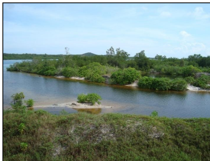
Gambar 3. Kondisi Mangrove Pada Stasiun 2

Lokasi Stasiun 2 terletak di Kampung Pasir tepatnya di wilayah Pesisir Utara Pulau Mendanau dengan kondisi mangrove yang sudah terganggu diduga akibat adanya kegiatan penebangan dan konversi lahan mangrove menjadi tempat pencucian bauksit, sehingga berdampak merubah zonasi mangrove yang ada. Mangrove tumbuh tipis dan tersebar secara tidak merata pada Stasiun 2. Gambaran kondisi mangrove pada Stasiun 2 disajikan pada Gambar 3 berikut ini.