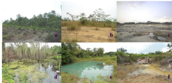
Gambar 1. Lokasi penelitian: a) hutan; b) lahan pasca tambang timah yang direklamasi; c) lahan pasca tambang timah belum direklamasi- berumur 0 tahun; d) sungai; e) kolong yang ditinggalkan; f) kolong aktif

belum direklamasi-berumur 0 tahun ( 02^{\circ}43.616 LS; 106^{\circ}29.596 BT), sungai ( 02^{\circ}44'24.00'' LS dan 106^{\circ}29'44.30'' BT), kolong aktif ( 02^{\circ}44'45.20'' LS; 106^{\circ}28'44.20'' BT) dan kolong yang ditinggalkan ( 02^{\circ}44'45.70'' LS; 106^{\circ}28'43.60'' BT) di Desa Bencah, Kecamatan Air Begas, Kabupaten Bangka Selatan (Gambar 1; Gambar 2).