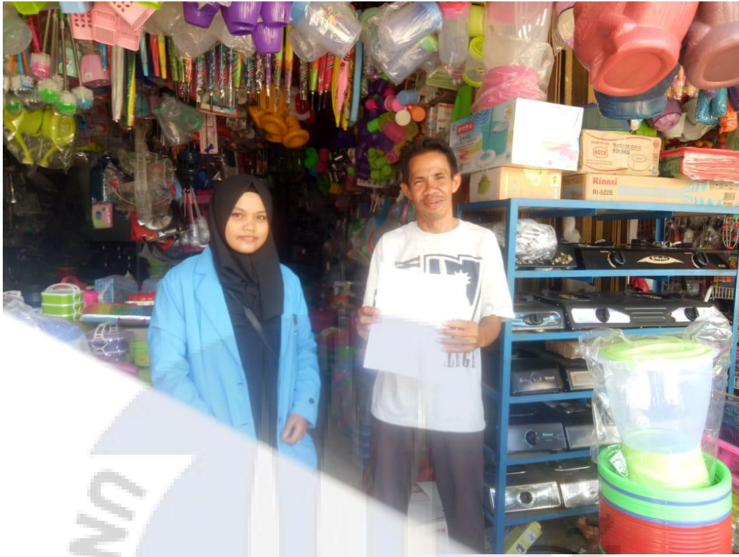
Informan 7 (Toko Achion)