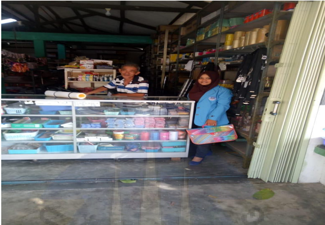
Informan 5 (Sumber Pengetahuan)