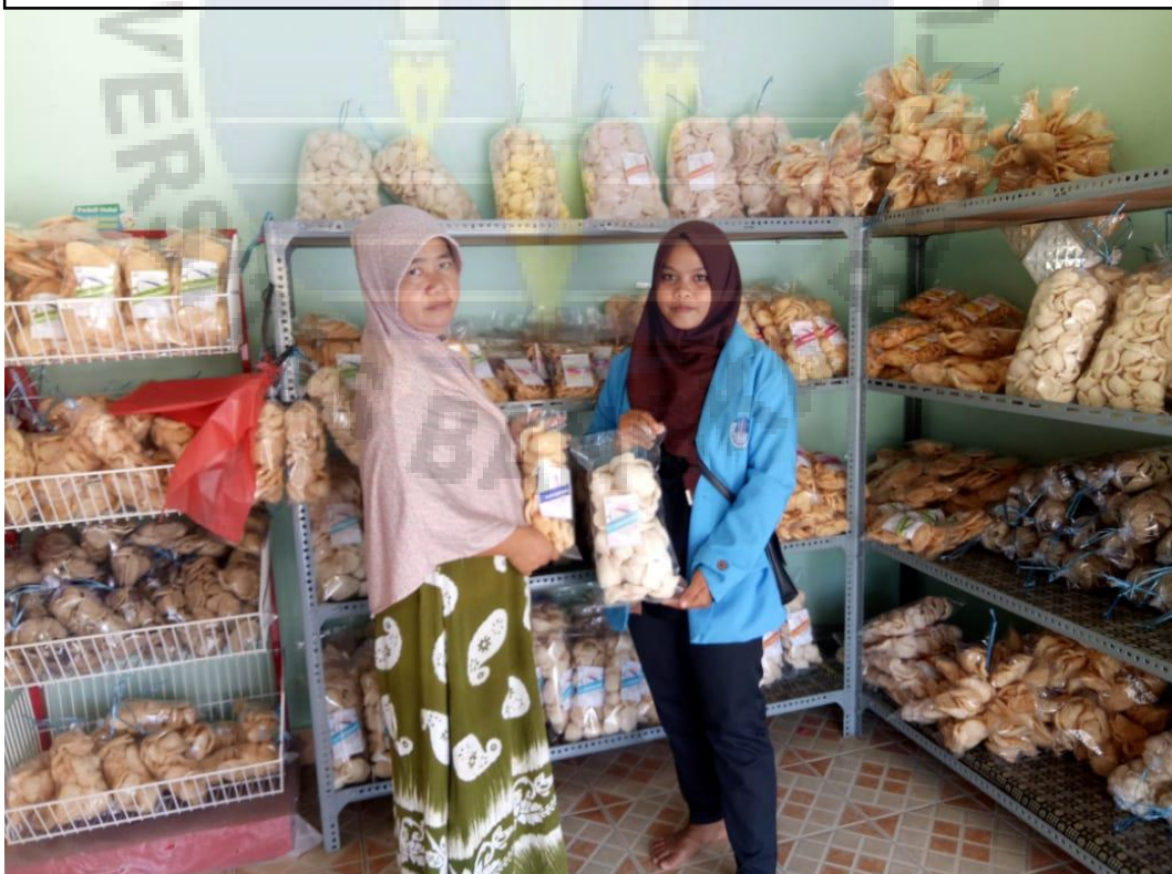
Informan 2 (Kemplang Damai Mandiri)