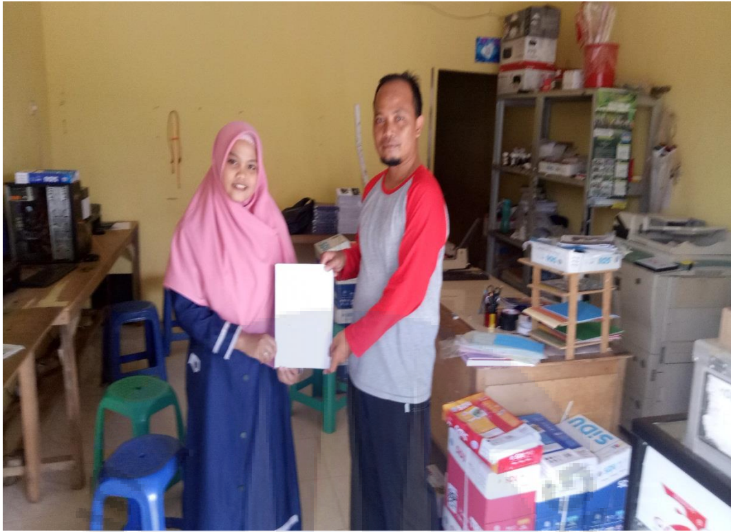
Informan 15 (Ridho Copy Center)