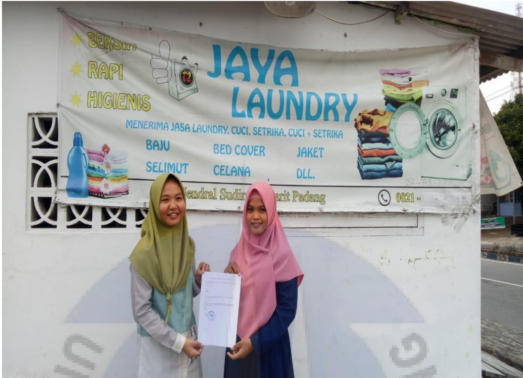
Informan 13 (Jaya Laundry)