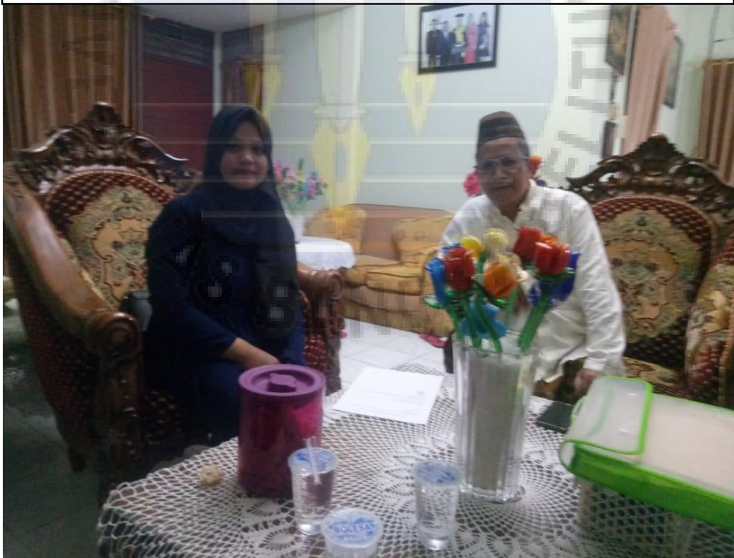
Informan 6 (Sumber Rizky Group)