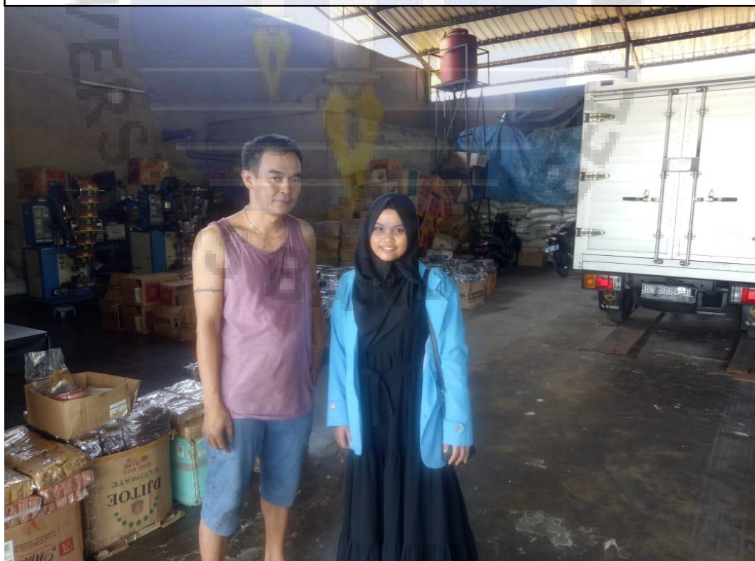
Informan 4(Kopi Kembang)