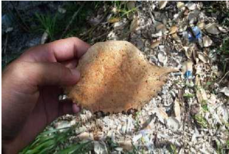
Gambar. I.1 Cangkang Kepiting di Desa Tukak