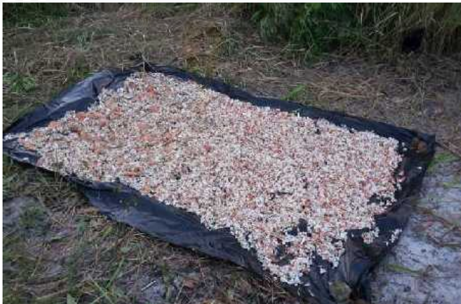
Gambar. I.2 Limbah Cangkang Kering

Untuk memenuhi kebutuhan dana dari sumber modal sendiri yang berasal dari modal saham, laba ditahan, dan cadangan. Jika pendanaan dalam suatu usaha berasal dari modal sendiri masih mengalami kekurangan maka perlu dipertimbangkan pendanaan suatu usaha berasal dari luar yaitu utang. Namun dalam pemenuhan kebutuhan dana suatu usaha harus mencari alternatif – alternatif pendanaan yang efisien. Pendanaan yang efisien akan terjadi apabila mempunyai struktur modal yang optimal.