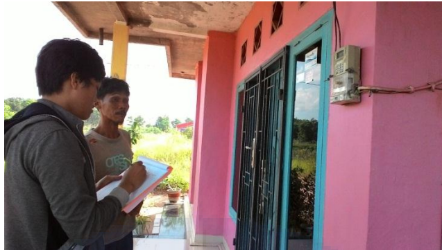
Survei Lokasi Perumahan Penduduk