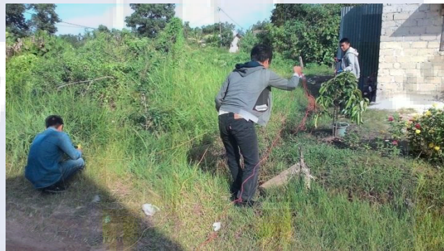
Pemasangan Elektroda Bantu