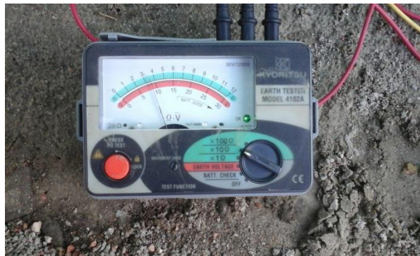
Hasil Pengukuran Tahanan Pentanahan