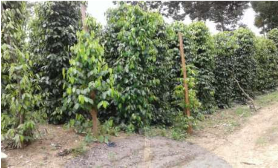
Gambar. 5. Salah satu lokasi perkebunan lada yang ada di Desa Bikang.