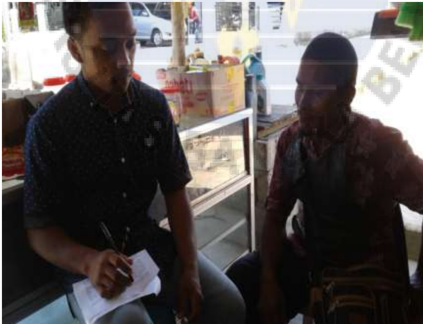
Gambar. 2. Penulis Melakukan wawancara dengan salah satu, Warga Desa Bikang