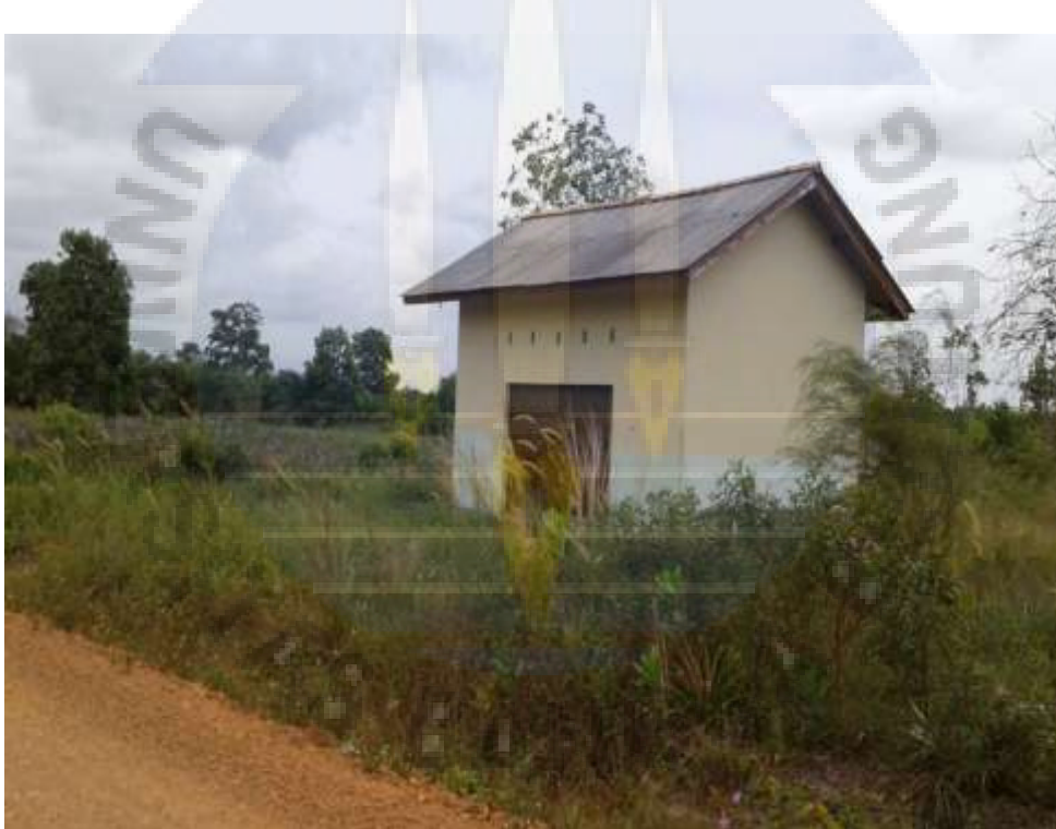
Gambar. 3. Salah satu lokasi proyek nanas dan perkebunan nanas di Desa Bikang.