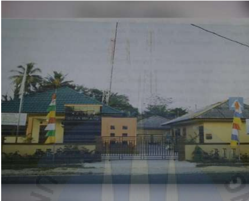
Gambar. 1. Salah satu lokasi yaitu kantor Desa Bikang.