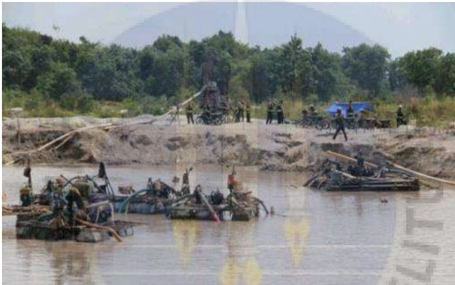
Gambar. 4. Salah satu lokasi penambang timah yang ada di Desa Bikang.